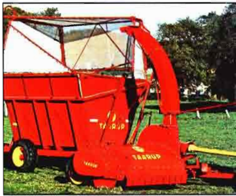
Fig 7: Cosechadora de doble corte.