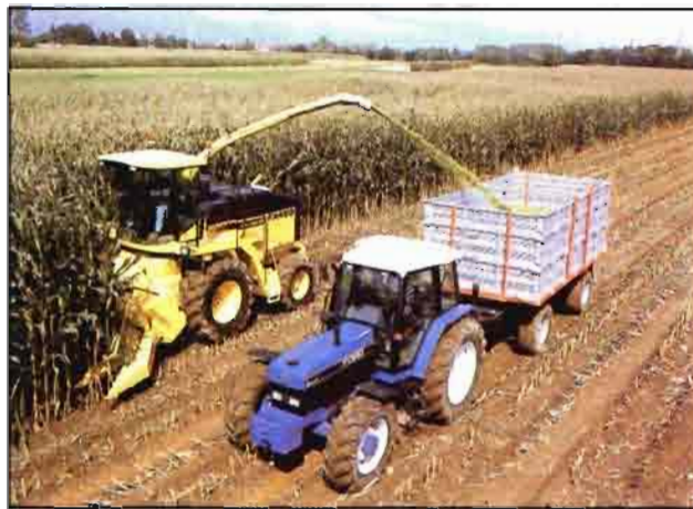
Fig. 3: Cosechadora autopropulsada recolectando maíz

• Ensuciamiento del forraje. En ciertas condiciones, particularmente en terrenos se-