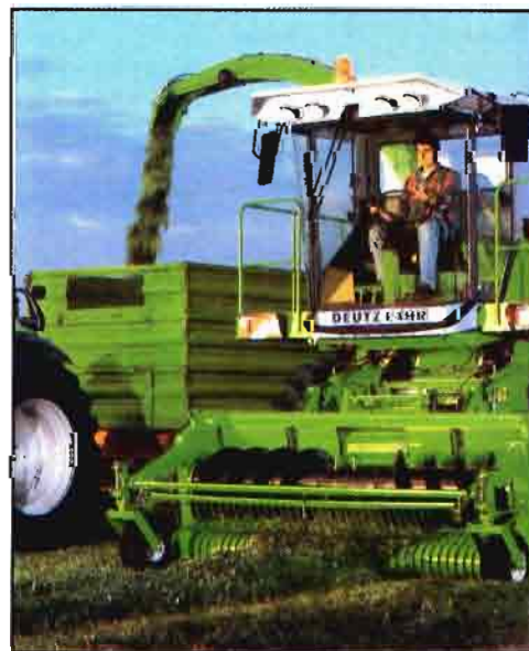
Fig. 4: Cosechadora autopropulsada con cabezal recogedor.

Realizan las operaciones de segar o recoger el forraje, picarlo y cargarlo a una tolva o remolque.