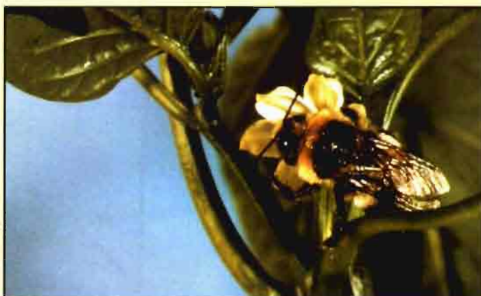
Conviene emplear productos que no acaben con los insectos útiles.

Dicha identificación, según el último borrador, podrá completarse con un logotipo que puedan establecer las CC.AA., sólo en el caso en que todo el proceso productivo se haya