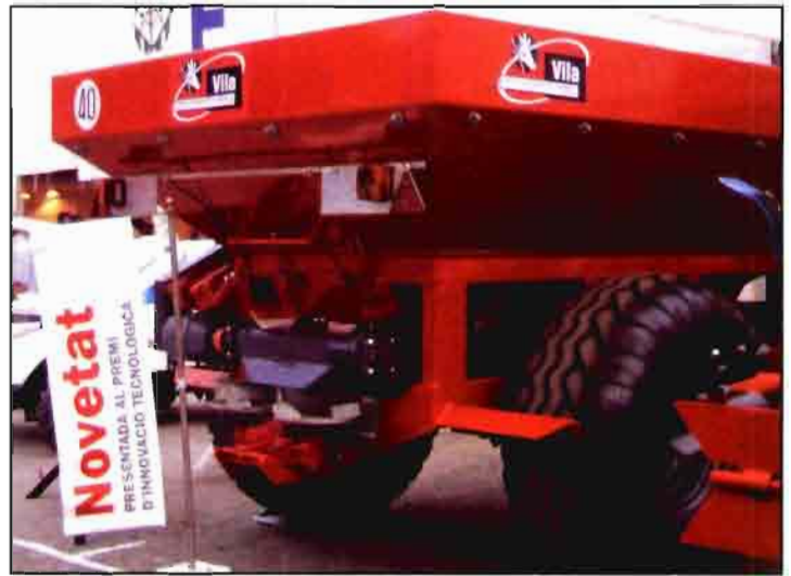
La abonadora centrífuga alimentada con cinta de PVC, de la empresa Vigerm, ganó el primer premio a la Innovación Tecnológica.

En el segundo Concurso, de Innovación frutícola, el primer premio correspondió a Caus-tier Ibérica, por un sistema automatizado para el llenado de cajas de fruta con una notable capacidad de trabajo y que puede representar importantes ahorros en el capítulo de la mano de obra en las centrales hortofrutícolas. El segundo premio se otorgó a Ecobee 2000, por el preparado de polen para favorecer el cuajado de los frutos, que ya hemos mencionado anteriormente. El tercero correspondió a Argiles, Disseny i Fabricació, por la máquina recogedora de fruta del suelo, que fue premiada, asimismo, en el otro Concurso, y que responde a una demanda creciente del sector para la pre-