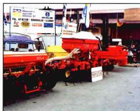
Las empresas radicadas en Cataluña, como Landini Ibérica, Antonio Carraro Ibérica y Maquinaria Agrícola Solá tienen una fuerte presencia en la Fira de Sant Miquel.

e instalaciones, mencionar de nuevo el robot de ordeño de Lely, uno de los más "a punto", que permite a las vacas acudir cuando quieran a la sala de ordeño, donde se les colocan y les quitan las pezoneras, por cuartos, una vez terminado el ordeño, sin ningún tipo de intervención humana.