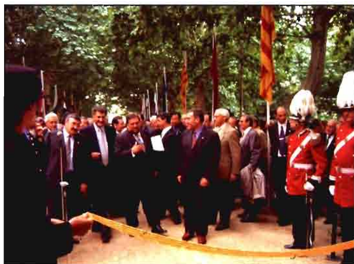
El ministro de Agricultura, Jesús Posada, inauguró la Fira de Sant Miquel.

Una de las ventajas de Sant Miquel para los muchos técnicos que acudimos puntualmente es que representa un punto de encuentro al "inicio de curso", o comienzo del "año agrícola", al que acuden buena parte de los diferentes actores del sector agrario catalán y, cada vez más, del resto de España y de otros países de la Unión Europea, con una presencia ya muy consolidada de Francia e Italia. Cabe destacar, en esta ocasión, la participación de 26 empresas expositoras directas procedentes de Francia, Italia, Portugal, Israel y China. Han acudido también representantes de la Cámara de Comercio e Industria de Kenitra i Sidi Kacem (Marruecos), de la ciudad china de Hefei, de la Cámara de Comercio e Industria de Ferrara y