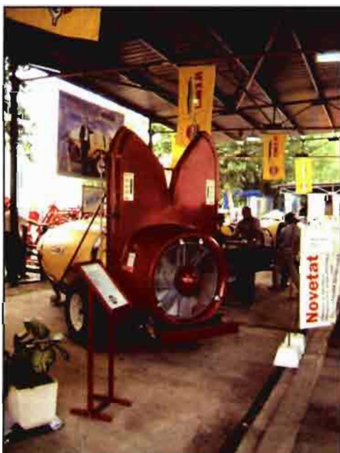
A la izquierda, llelmo-Hardi ganó el segundo premio a la innovación Tecnológica con una mejora técnica de sus pulverizadores. Abajo, el robot de ordeño, de Lely Industries, que ganó una mención especial. También se llevó mención New Holland, a la derecha, por su suspensión delantera con control electrónico.

La presencia de ganado ha conocido oscilaciones notables a lo largo de los años. La producción principal de las comarcas colindantes, el cerdo, ha conocido dificultades para ser exhibida. Pero, aunque limitado, el ganado ha continuado manteniendo una presencia significativa. Destacar este año la calidad de los animales frisonos presentes y la presencia de unos cuantos emús, una de las producciones emergentes, alternativa a los avestruces que hemos visto otros años. Dentro de los equipos