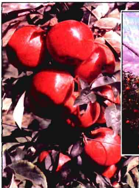
El sector frutícola es uno de los mejor representados en la Fira, con su propio Salón, Eurofruit. Este año se pudieron ver soluciones tan interesantes como la malla antigranizo (arriba) y un buen número de nuevas variedades (izda.).

Uno de estos sectores, por su importante presencia en la zona, la fruticultura (Cataluña produce alrededor de un 40% de la fruta dulce española y Lleida, un 80% de la catalana) tiene entidad propia en la Fira desde hace 14 años: Eurofruit, Salón Internacional del sector de la fruta, que representa uno de los principales focos de interés. A las magníficas exposiciones de la fruta producida en la comarca, muy bien presentadas, se han ido añadiendo las nuevas variedades con mayor presencia en los mercados; el material vegetal seleccionado y con las máximas garantías sanitarias; una notable presencia de equipos y maquinaria para las distintas operaciones de post-cosecha y comercialización; embalajes; sistemas de protección, además de los "clásicos" pero siempre actualizados productos fitosanitarios (mallas de protección antigranizo, sistemas antiheladas...).