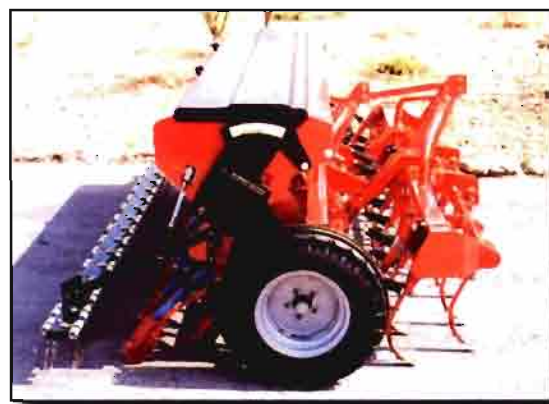
EQUIPO DE SIEMBRA COMPACTO DE PREPARADOR CON TABLA Y MÁQUINA