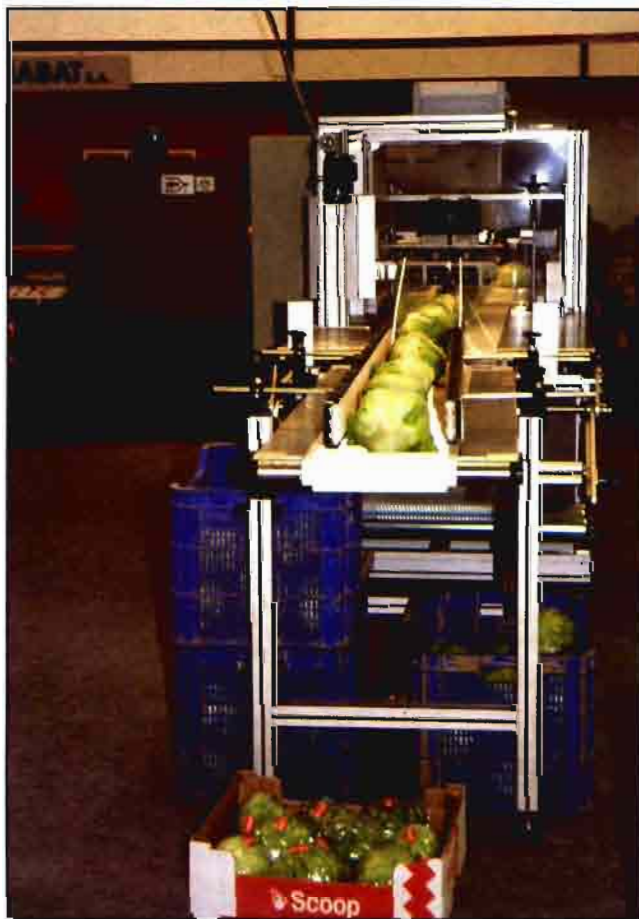
El MAPA quiere regular la "extensión de normas" del sector hortofrutícola.

La solicitud de establecimiento de circunscripciones económicas que afecten a varias CC.AA. debe ser resuelta por la Dirección General de Agricultura del MAPA, exigiéndose la relación del producto o productos para los que se solicita el establecimiento de la circunscripción; la delimitación geográfica y términos municipales a incluir, así como la memoria justificativa de la homogeneidad de la producción y la comercialización del producto o produc-