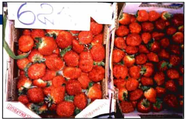
El fresón de Huelva es uno de los sectores que cuentan con OPFH.

La petición tendrá que dirigirse al órgano administrativo (autonómico o estatal) que declaró obligatorias las normas, con indicación del importe unitario que se pretende introducir, aportando la base de cálculo y la documentación justificativa, así como el/los beneficiario/s de las contribuciones y el destino de las mismas. Dicho órgano será competente para resolver motivadamente la solicitud de que los productores no miembros abonen a la OPFH o Asociación la parte de las contribuciones financieras correspondientes, así como de su control para el correcto cumplimiento de las normas extendidas, así como de su anulación si procede, al margen de las