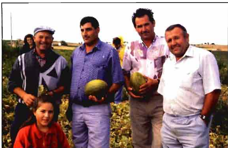
Las circunscripciones económicas se definirán en función del producto o los productos hortofrutícolas a los que afecta, así como de la delimitación geográfica.

tos en la delimitación geográfica que se propone.