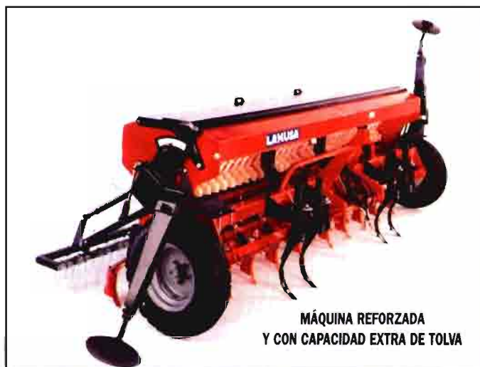
MÁQUINA REFORZADA Y CON CAPACIDAD EXTRA DE TOLVA