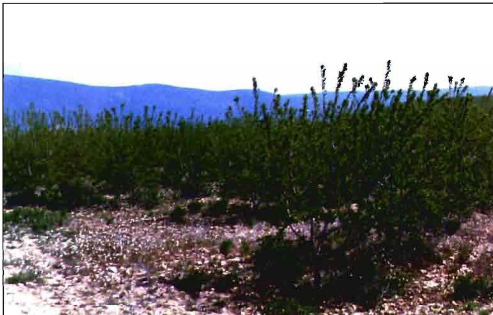
El almendro es el cultivo de frutos secos más extendido en España. Ocupa unas 544.186 ha.

Cifras a 1 de julio en miles de toneladas cáscara.