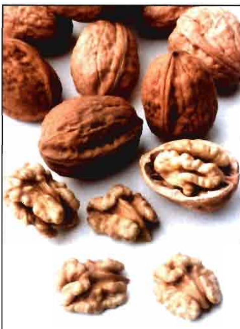
La nuez española sufre la competencia de la americana.

Es más, esta ayuda percibida por los productores a través de los