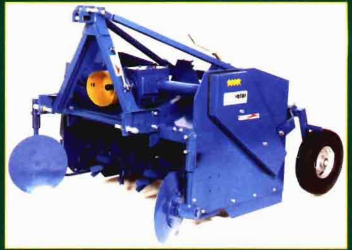
Robomulchadora BAP150H-FC200 con diferentes anchuras de trabajo.

Según el informe del sector, la aplicación de las ayudas específicas para los frutos de cáscara y algarrobas ha tenido para el sector espa-