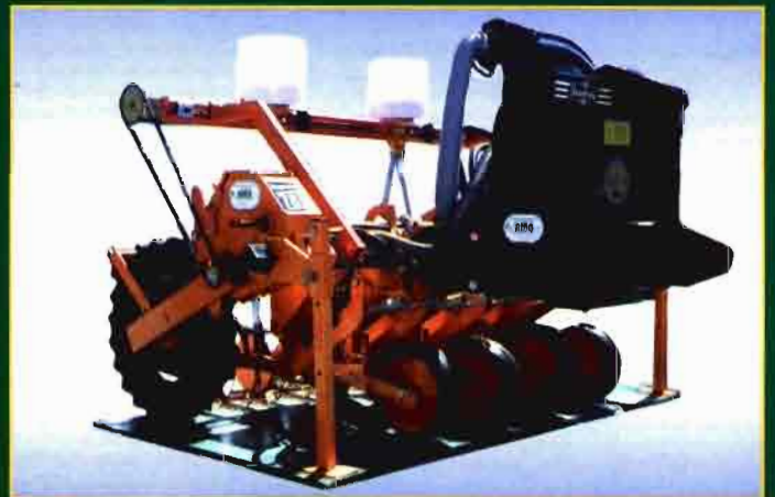
Demarcación mecánica y mecánica de precisión OT4000H para arar, labrar, rastrar, etc.