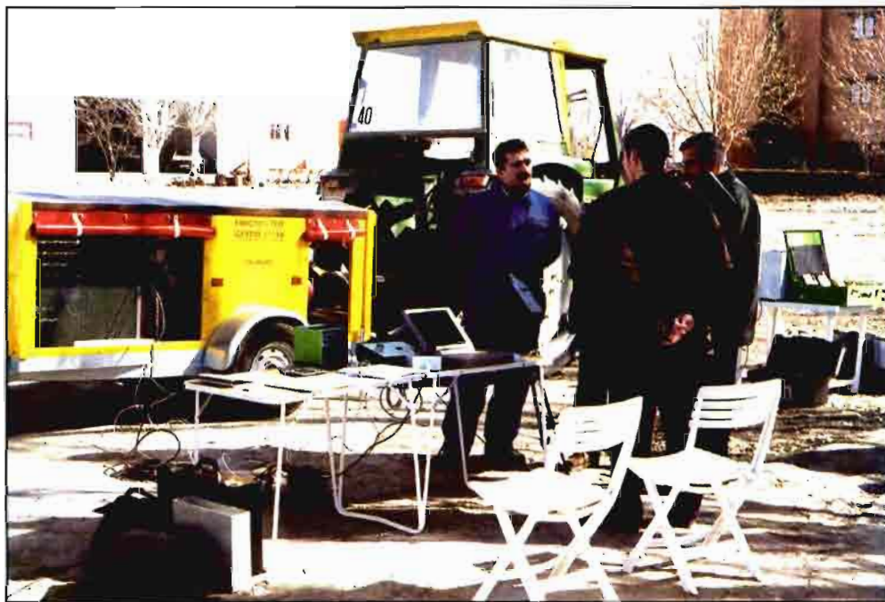
La Consejería de Agricultura y Pesca de Andalucía ofrece un servicio de asistencia técnica de tractores.

El servicio acoge la posibilidad de ayudar en la toma de decisiones en los temas relacionados con la mecanización de la explotación agraria, facilitando información sobre nueva