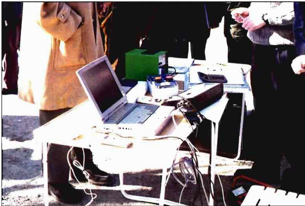
El equipo de trabajo está dotado de material diverso, necesario para el diagnóstico del tractor.

En combinación con el dato anterior permite caracterizar el funcionamiento del motor a distintos regímenes de revoluciones. Se mide el combustible consumido en el motor a través de un caudalímetro, y se consigue determinar el consumo específico, índice del rendimiento energético del motor.