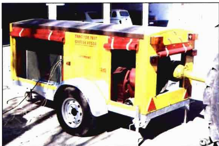
El diagnóstico del estado del tractor se realiza en unos 45 minutos.

maquinaria, técnicas de laboreo, evaluación de costes de funcionamiento, etc.