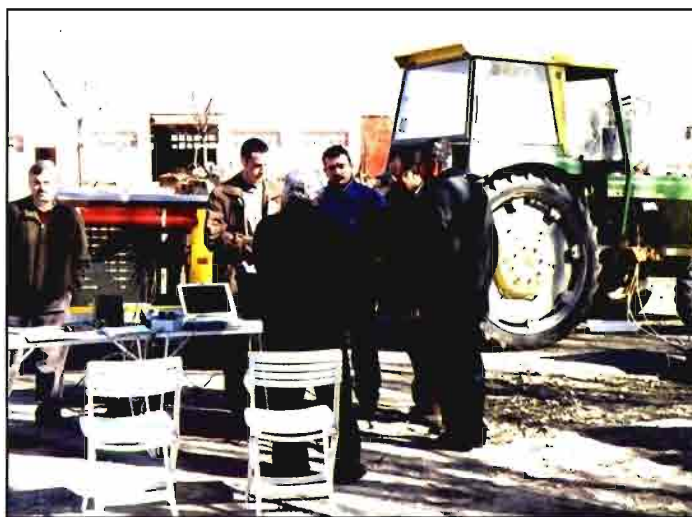
El parque de tractores está anticuado, aunque no presenta graves deficiencias.

Por lo tanto, la CAP de la Junta de Andalucía pretende continuar con esta línea de trabajo a la vista de la aceptación conseguida, incrementando los equipos presentes en años sucesivos, y ampliando los objetivos de los trabajos hacia otras máquinas y equipos. ■