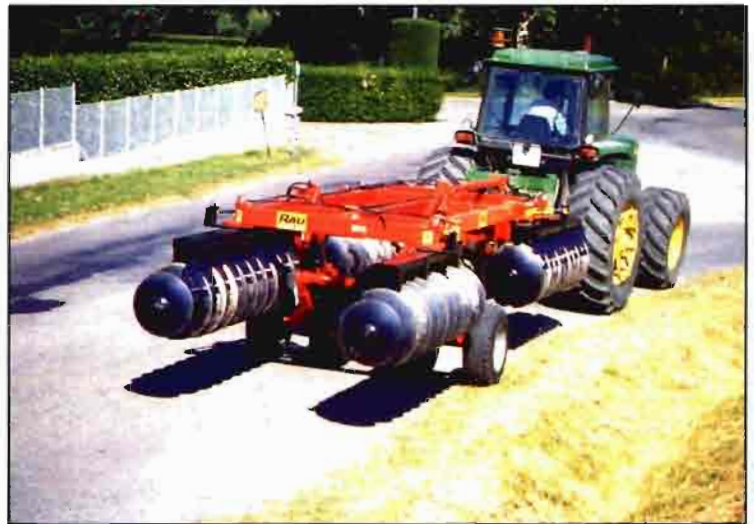
Grada de discos pesada Onyx de RAU-Jean de Bru plegada para el transporte.

4. Conformar la superficie del terreno. La movilidad de la maquinaria empleada en las labores de cultivo requiere una determinada configuración de la superficie del terreno. Por ejemplo, en las zonas regables dicha superficie se dispondrá de suerte que el paso de maquinaria ocurra sin que disminuya la eficacia del sistema de riego a la hora de aplicar el