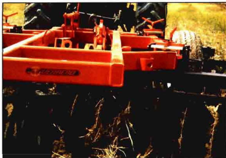
Grada de discos de Guerrero, adecuada para incorporar abonos al suelo.