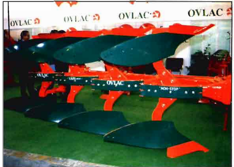
Arado de vertedera Varilabor de Ovlac, con sistema de seguridad "Non-Stop".

agua; en áreas de precipitaciones abundantes, la superficie del terreno se conformará para asegurar un rápido drenaje del suelo con el mínimo riesgo de erosión y la máxima capacidad de almacenamiento del agua; por último, en lugares de escasa pluviometría se procurará retener la mayor cantidad de agua en la superficie del terreno para facilitar su infiltración y posterior acumulación en el suelo.