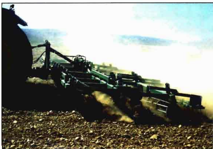
Cultivador con rodillo y grada de púas de Julio Gil en plena labor.

Llegados a este punto, sólo nos resta elegir con un mínimo de criterio las labores más adecuadas al contenido de humedad del suelo y, para ello, nada mejor que volver a la fig. 1. Este objetivo también podemos plantearlo en los siguientes términos, conocido el estado que queremos alcanzar en el suelo debemos ser capaces de escoger el apero más apropiado para trabajar eficazmente en las condiciones de humedad y consistencia en que aquél pueda encontrarse. En el proceso de transformación de un estado inicial a otro final será necesario que los aperos que usemos realicen alguna de las siguientes operaciones de laboreo: modificar y reordenar el tamaño de los agregados; reducir el tamaño de los mismos;