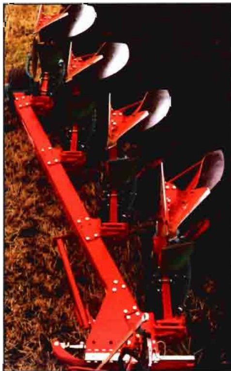
Arado reversible Kverneland EM/LM de cuatro surcos.

Cuando se invierte el suelo para enterrar malas hierbas o restos de la cosecha que quedan en la superficie del terreno, el apero corta un prisma de tierra y después lo voltea. El corte del prisma se realiza sin dificultad en estado friable y en el plástico, pero su inversión re-