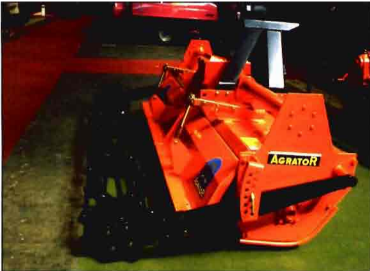
La maquinaria agrícola de Agrator está diseñada para suelos duros.