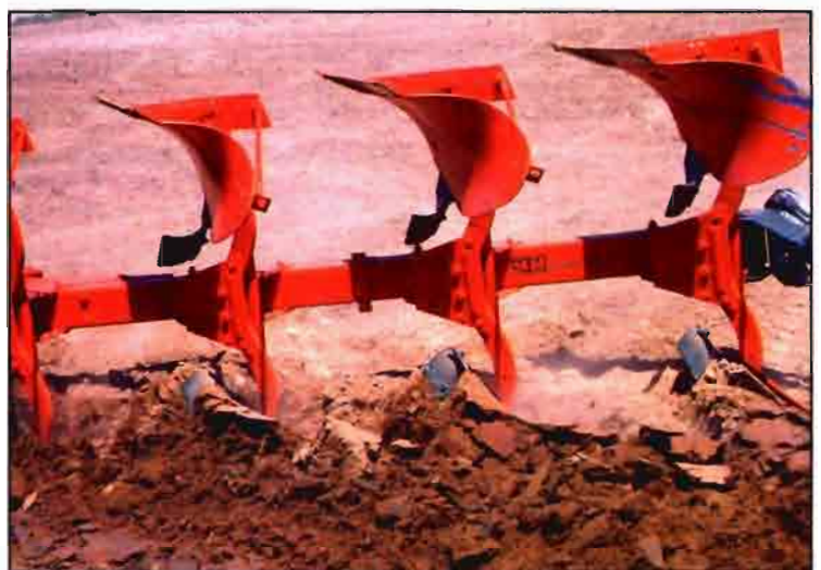
El arado de vertedera (Vogel & Noot) es el apero de labranza tradicional.