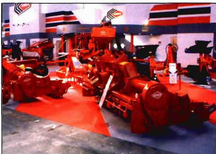
Amplia gama de aperos de Kuhn para las diferentes tareas de preparación del suelo.