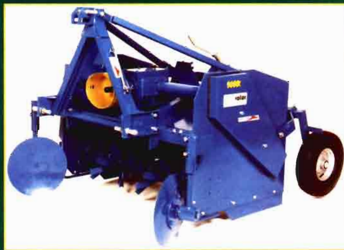
Reproductores para el cultivo de algodón con diferentes anchuras de trabajo.