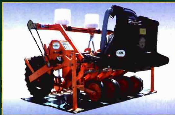
Reproductores para el cultivo de maíz con precisión ST Admin para sembrar, arar, sembrar, etc.