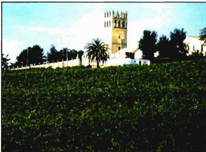
La Producción Integrada permitirá una mayor calidad del vino de Jerez.

La Producción Integrada «es un sistema de explotación agraria que produce alimentos y