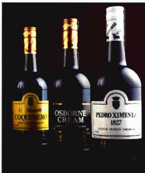
Algunos de los vinos de Jerez de Osborne.

A la hora de realizar la nueva plantación será obligatorio utilizar portainjertos de productores oficialmente autorizados, con certificado y pasaporte fitosanitario, así como ser de