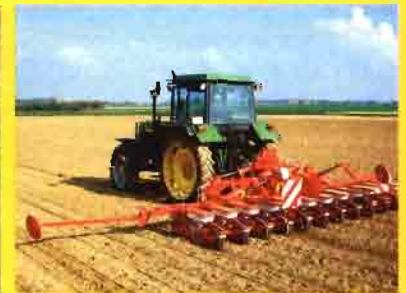
Kverneland Accord Monopill Sembradora mecánica para remolacha

Encintadora arrastrada para pacas redondas. Funcionamiento trasero al tractor, con horquilla de carga lateral. Descarga desde mínima altura. Ideal para el agricultor medio. Manejo de pacas hasta un máximo de 900 Kg.