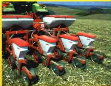
Kverneland Optima NT Cuerpo de siembra

Sistema abonador pendular que gracias al tubo de esparcimiento pendular, la dosis es exactamente la misma a ambos lados, asegurando un buen solape. Tolva de poliéster reforzada con fibra de vidrio, resistente a los abonos agresivos. Posibilidad de regulación de km/ha constante, reduciendo al mínimo los errores.