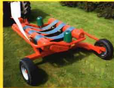
Kverneland UN7335 Encintadora de pacas redondas

Chasis con 4 unidades de siembra (No Till). Profundidad de trabajo infinitamente ajustable, gracias a las ruedas laterales de control de profundidad. Para siembra de maíz, girasol, judías, remolacha, etc. Siembra convencional, directa y sobre "mulching".