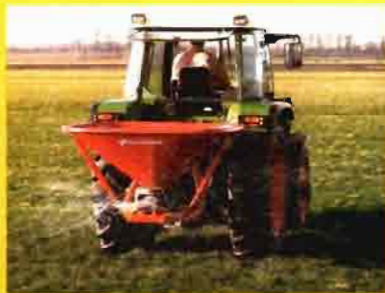
Kverneland PS Abonadora suspendida pendular

Sistema abonador pendular que gracias al tubo de esparcimiento pendular, la dosis es exactamente la misma a ambos lados, asegurando un buen solape. Tolva de poliéster reforzada con fibra de vidrio, resistente a los abonos agresivos. Posibilidad de regulación de km/ha constante, reduciendo al mínimo los errores.