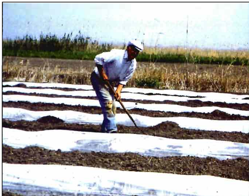
Un 45% de los agricultores y ganaderos considera que vive algo mejor que hace 10 años.

media, con un 20,8% del total, declara contar con unos ingresos brutos de entre dos y cinco millones de pesetas al año. Algo más del 6% de los que contestan dicen estar entre 1,6 y 2 millones de pesetas, el 6,6% entre los 5 y los