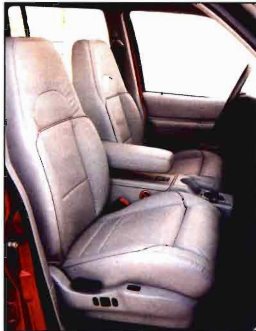
El Explorer posee un puesto de conducción en alto, lo que le proporciona una gran visibilidad al conductor.

De importancia para nuestros lectores es el gran y poderoso motor que el Ford Explorer