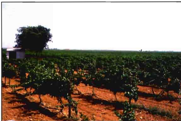
Los precios de los vinos se mantienen a la espera de la próxima OCM.

Se abre la posibilidad de que España pueda seguir mezclando vinos tintos y blancos.