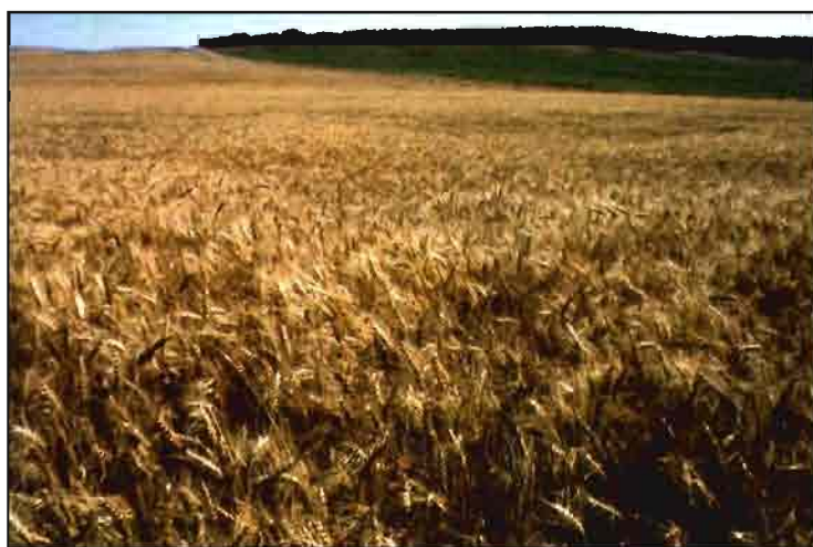
En cereal, se mantiene el precio de compra por la Intervención en 19,83 ptas./kg.

En cualquier caso, las modificaciones profundas que se esperan introducir en los principales subsectores agrícolas, así como los arduos trabajos de desarrollo de la reglamentación posterior, no hacen demasiado aconsejable ni recomendable el adelanto al paquete de precios agrarios de la campaña 1999/2000 de parte de las reformas que vienen.