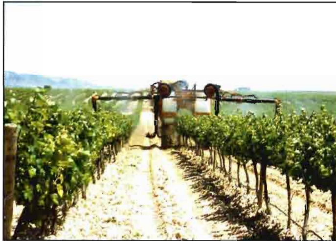
Es esencial la correcta elección y aplicación de los productos fitosanitarios.

Las exigencias que deben cumplir los fitosanitarios son más de las que tiene que cumplir cualquier otro producto, incluidos los fármacos. Este proceso de análisis consta de