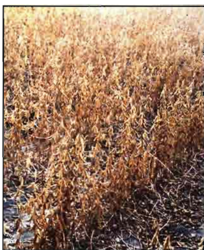
Hay que buscar alternativas productivas a los cultivos oleaginosos (en la foto, soja).

más baratas y competitivas, debido a la disminución de la diferencia entre los precios internos y los mundiales, que traerá dichas reformas.