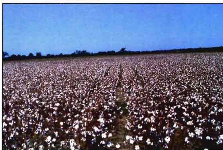
El algodón es el cultivo no alimentario más extendido en la UE.

Se necesita una estrategia, como apunta el sector de oleaginosas, que sea, por una parte, autónoma, coherente y global y, por otra, que sepa combinar todo tipo de apoyos e instrumentos (es-