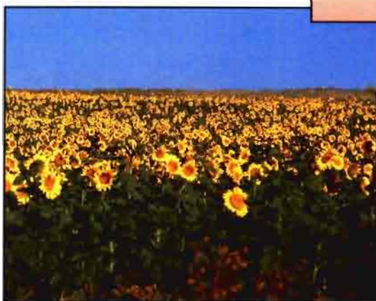
Los aceites vegetales pueden destinarse a producir lubricantes.

Algunas cuestiones importantes tienen que ser contestadas en cuanto a los biocombustibles líquidos. Estas se refieren a sus ventajas potenciales y a los instrumentos de política más eficientes para disponer de ellos.