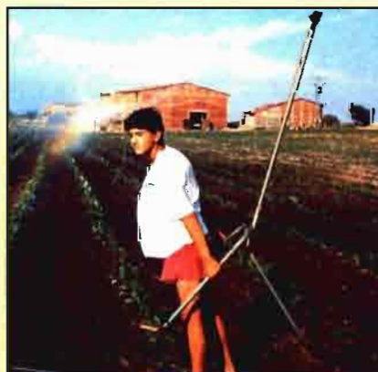
Hay que incentivar la incorporación de los jóvenes a la actividad agraria.

Estas ayudas comunitarias a favor de un desarrollo rural sosten-