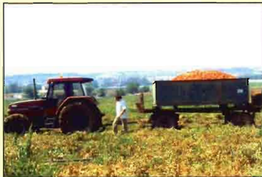
Hay que mejorar las condiciones de trabajo en el campo.

En el desarrollo de la agricultura y de las nuevas funciones que está asumiendo el medio rural, la juventud ostenta un lugar estratégico e insustituible. Así, todas las Organizaciones Profesionales Agrarias (OPAS) han reclamado en sus respectivos programas electorales difundidos en las recientes elecciones al campo celebradas en Extremadura, la aplicación de medidas que favorezcan el acceso e incorporación de los jóvenes a la actividad agraria.