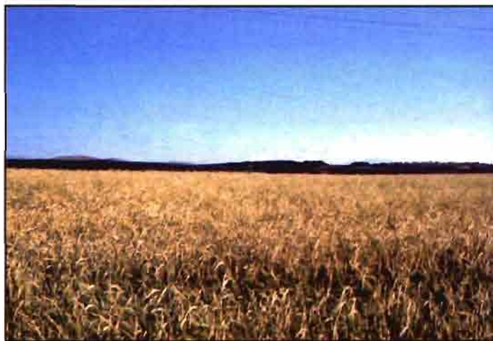
La mayor entrada de cereal comunitario disminuirá los precios del español.

El arroz está teniendo en estos momentos muchos problemas, debido a las importaciones de países terceros (en muchos casos en régimen preferencial) y a una nefasta reforma de la OCM que se hizo en su momento. El euro no va a contribuir en nada a mejorar esta situación,