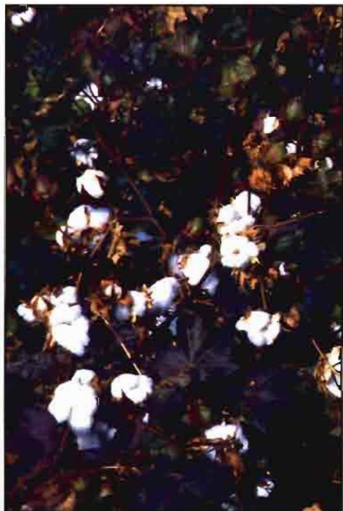
Si no cambia el régimen de ayudas, la implantación del euro no influirá en los precios del algodón.

Europa es muy deficitaria en algodón, por lo que importa cantidades considerables procedentes, sobre todo, de EE.UU., Egipto, Turquía, Irán, Uzbekistán, India, China... La producción de España y Grecia no es más que un pequeño porcentaje del consumo europeo de algodón.