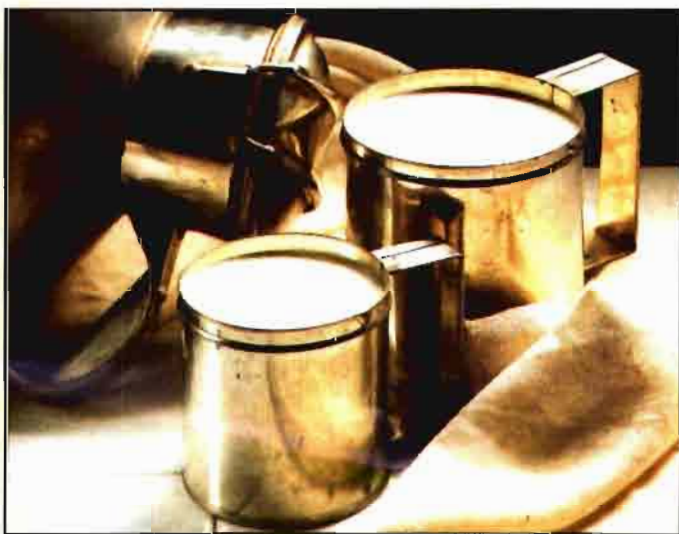
La leche está sometida a un régimen de cuotas por Estado miembro.

« La estabilidad que dará el euro será positiva para la política agraria, pues garantiza saber a priori los importes de ayudas y precios institucionales »