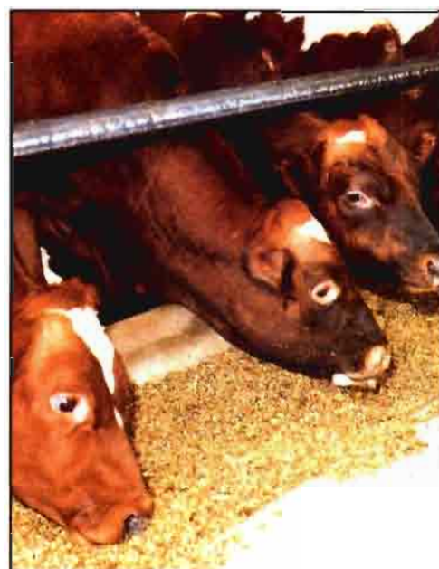
La UE tiene excedentes crónicos de vacuno de carne.

El principal problema del vacuno de carne en Europa son los excedentes crónicos, agravados por una tendencia al descenso del consumo que es anterior a la crisis de las vacas locas (ya estaba antes la mala prensa de las hormonas). Europa es netamente exportadora de carnes de vacuno hacia países terceros. Además conserva todavía unos fuertes aranceles frente a las importaciones de países terceros.