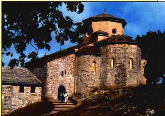
Santuario de San Miguel de Aralar, iglesia románica del siglo XI.

Queda, finalmente, la cuarta ruta, Ulzama-Basaburúa, quizá la más favorecida desde el punto de vista ecológico, pues permite conocer uno de los últimos vesti-