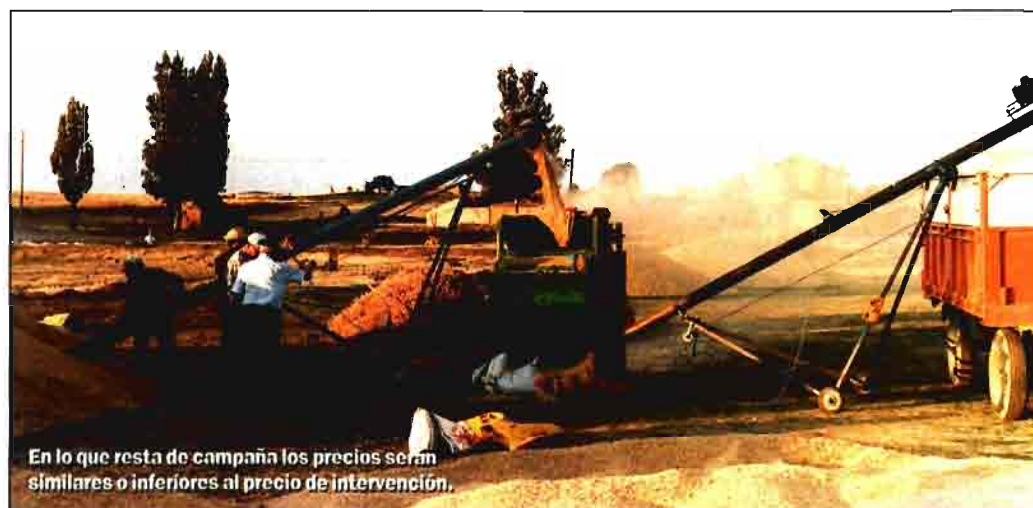
En lo que resta de campaña los precios serán similares o inferiores al precio de intervención.

En relación a la pasada cosecha de este cereal, las últimas previsiones de la Confederación de Cooperativas Agrarias de España (CCAE) daban una cifra total de 10.468.924 toneladas (65,41% del total de la cosecha de cereal de otoño/invierno) y