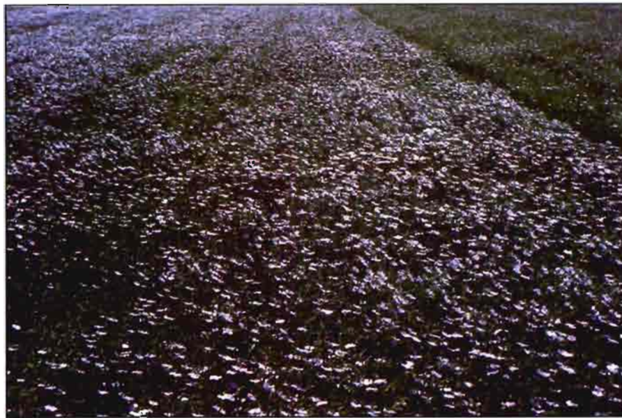
Tanto el lino textil como el oleaginoso están incrementando su superficie sembrada en España.

presas transformadoras de lino textil no son las que tendrían que ser, por lo que se exige que se conceda por parte de las Administraciones a este asunto la máxima prioridad. Por ejemplo, que este tipo de industrias trabajen con dos lotes de paja homogéneos: uno bien enriado y otro sin enriar, que se precintarán y distribuirán entre las empresas a autorizar; que definan el tipo de fibra a obtener, dado que tan importante para la homologación es el tipo de paja, como el tipo de fibra resultante, etc.