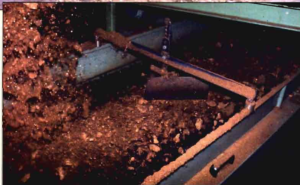
La producción de la industria española de fertilizantes durante 1997 se situó en 5,59 millones de toneladas.

guir concienciando, y así es asumido por la industria de fertilizantes, sobre la necesidad de establecer una buena planificación del abonado racional de los cultivos, la aplicación de códigos coherentes de buenas prácticas agrícolas, la adecuada gestión económica de las explotaciones, todo ello como base de actuación en una agricultura moderna. Esta agricultura deberá seguir buscando prácticas culturales que potencien la economía de las exportaciones y que en el caso de los fertilizantes tienen una buena referencia en los avances habidos en la oferta de nuevos productos y la cada vez más común práctica de la fertirrigación.