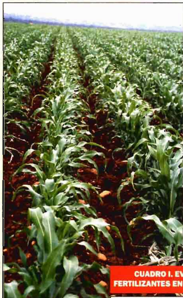
CUADRO I. EVOLUCIÓN DEL CONSUMO DE FERTILIZANTES EN ESPAÑA (MILES DE TONELADAS).