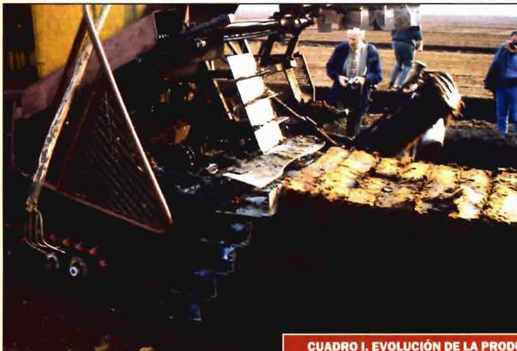
En el desarrollo de la industria de fertilizantes ha influido la aportación de tecnología en la producción.

petencia, a veces desleal, de las importaciones originarias de terceros países, especialmente del este europeo.