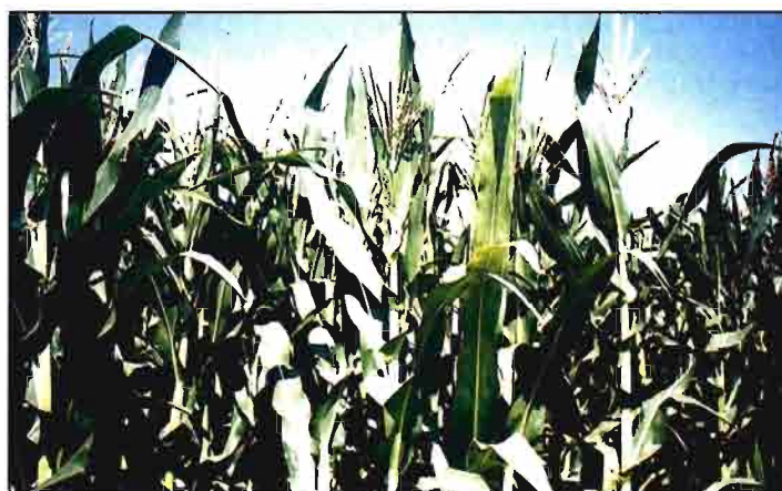
La producción de maíz en España podría incluso desaparecer tras la reforma.

Además, el hecho de que la CE sólo prevea una compensación del 50% de la disminución del 20% del precio de intervención, subiendo el pago directo de 54,24 ecus/t (unas 9.129 ptas./t) a 66 ecus/t (unas 11.000 ptas./t), que en total no llegaría a los 40.000 millones de pesetas, supondría una