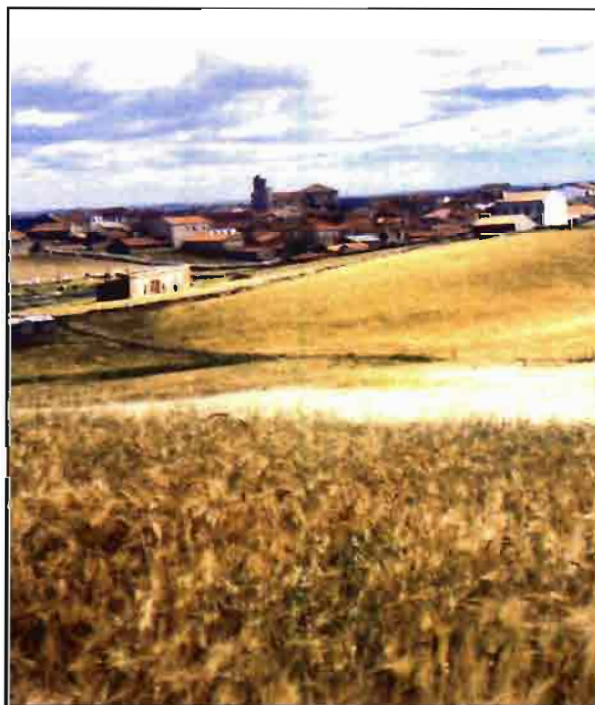
La PAC incluye también un programa de apoyo al desarrollo rural.

Con la financiación pretendida por la CE se incrementan los fondos destinados a las producciones continentales, mientras se