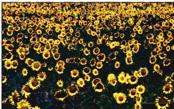
Se pretende eliminar el pago específico actual para el cultivo de oleaginosas.

Como se sabe, España es el país de la UE que tiene un rendi-