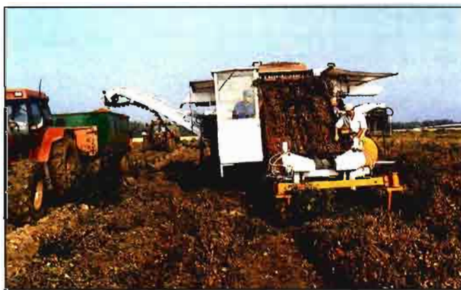
Las cosechadoras de hortalizas, remolacha... aún se venden poco.

Finalmente, habría que destacar que se vendieron más tractores de segunda mano (24.022 unidades) que nuevos (22.518), siendo los de más de 16 años de antigüedad los que más cambiaron de titular. En Galicia, Castilla-La Mancha y Extremadura es donde más marcada es esta circunstancia.