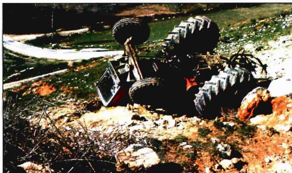
La maquinaria agrícola inservible no suele darse de baja en el Registro.

El total de tractores nuevos inscritos es de 22.518 unidades, un 18,3% más que en 1996, con las siguientes características: