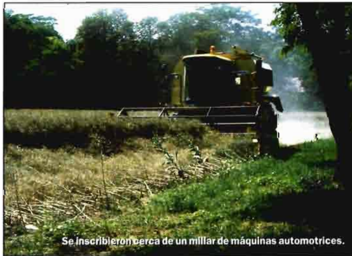
Se inscribieron cerca de un millar de máquinas automotrices.

Hay que considerar antes de acometer las estadísticas, el escaso porcentaje de las que se inscriben en relación con las ventas reales. Pudiendo estimarse en menos del 1% en maquinaria para trabajo del suelo, un 4% en sembradoras y abonadoras, un 30% en equipos de tratamiento, un 26%