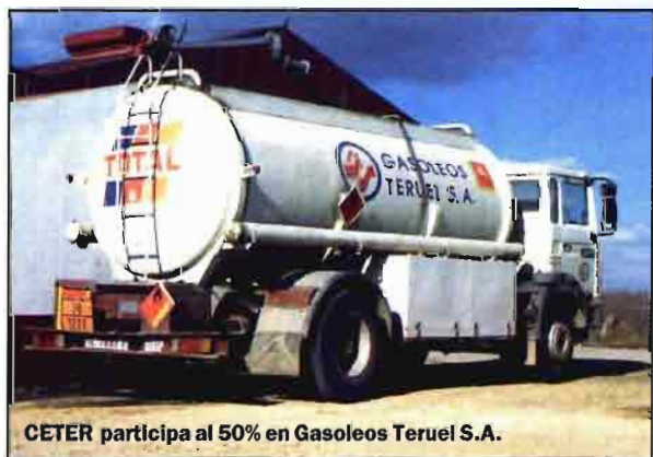
CETER participa al 50% en Gasoleos Teruel S.A.

La comercialización de lubricantes se hace a través de la Cooperativa que tiene la distribución de los lubricantes de la gama agrícola de la firma TOTAL para toda la provincia de Teruel. La gama industrial y de automoción está presente sólo para el Alto Teruel.