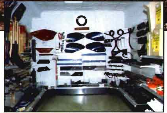
Los almacenes tienen todos la misma imagen exterior.

operativa, va mal no afecte al socio de CETER. De hecho, hasta ahora no ha habido ningún problema.