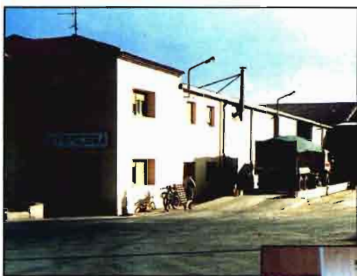
Arriba, exterior de la empresa FERTESA. Abajo, sección de alimentación de uno de los «Merca Cop».