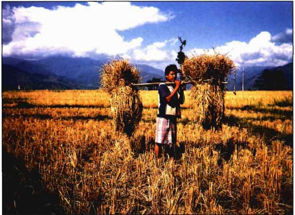
La importación indiscriminada de arroz de terceros países hace bajar el precio del arroz producido en España.

A esto habría que unir el «aberrante» tratamiento que, por parte de la CE, se da a este sector, al aplicar un multiplicador de la penalización, como ha quedado dicho, sobre la SB sobrepasada, que supone reducir en un porcentaje importante el pago compensatorio. Algo que no tiene parangón en ninguno de los subsectores de herbáceos, que se encuentran también contingentados por un cupo de SB garantizada.