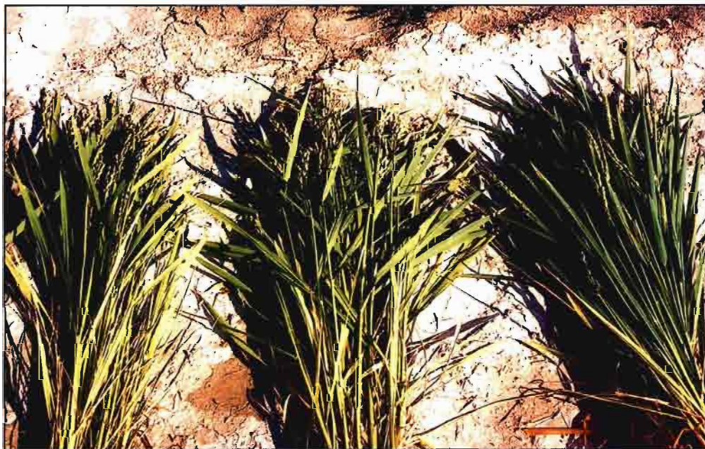
Distintas variedades de arroz. De izqda. a dcha.: Lotto, Lido y Tainato.

C omo si nuestro país no tuviera problemas suficientes con el resto de los cereales, ahora es el arroz el que se convertirá, sin duda, en una producción que creará también controversia en los próximos años. En primer lugar, porque se trata de un cultivo contingentado, al igual que los demás herbáceos, lo que limita muy mucho el aumento de las siembras, sobre todo en aquellas CCAA que han incrementado su superficie en las últimas campañas (Aragón, Navarra, Cataluña), al estar condicionada la concesión de las ayudas compensatorias a una superficie base, que se ha visto superada ante una situación agroclimática normal.