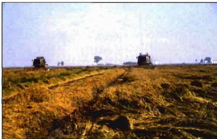
La cosecha de arroz ha aumentado casi un 4% en la última campaña.

se escogió la campaña más favorable. Así, para Andalucía se tomó la referencia de la campaña 1991/92, dado que en las siguientes las siembras se vieron seriamente afectadas por la contingencia climática y la insuficiencia de agua para riego, con lo que se estableció unas 34.500 ha; para Aragón, la campaña de referencia tomada fue 1994/95 (la última antes de la reforma para aprovechar su crecimiento), con 9.500 ha; para Castilla-La Mancha se tomó la campaña 1991/92, por los mismos motivos que en Andalucía, con 160 ha; en Cataluña, al igual que Aragón, se escogió la mejor de las cosechas, la 1994/95, con 22.500 ha; en Extremadura, igualmente afectada por la sequía, se tomó la campaña más favorable, la de 1992/93, con 20.300 ha; en Murcia, con 330 ha; Navarra, con 1.500 ha, y Valencia, con 15.675 ha, se tomó la campaña 1994/95, antes de la reforma. En total, 104.465 ha.