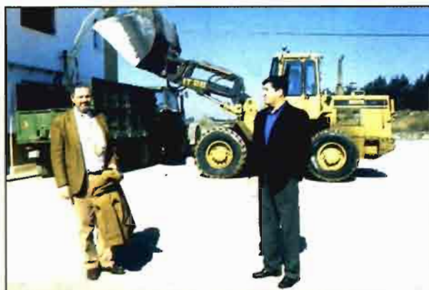
Presidente (dcha.) y gerente (izda.) en la Cooperativa.

La Cooperativa Virgen de la Oliva tiene un importante número de actividades y servicios enfocadas a sus socios. Una de las principales son los suministros de todo tipo de productos agrarios: fertilizantes, semillas, fitosanitarios, servicio técnico de asesoramiento, ferretería agrícola, servicio de tratamientos fitosanitarios, alquiler a socios de abonadoras, sembradoras de maíz y girasol, sembradora de hortalizas,