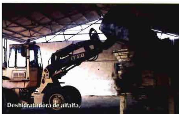
Deshidratadora de alfalfa.