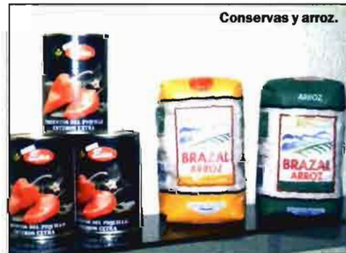
Conservas y arroz.

cación llevada a cabo durante los últimos años ha dado sus frutos. Así, en 1986 el monocultivo de cereal ocupaba el 80% de la actividad de la Cooperativa, mientras que en 1998 solamente ocupa el 30%, habiéndose abierto a todo tipo de actividades y servicios.