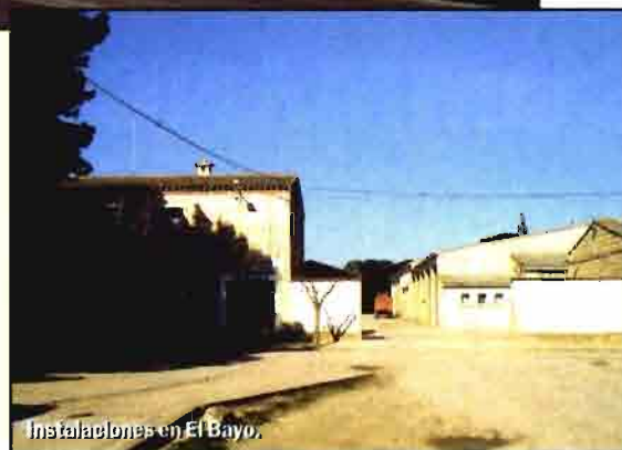
Instalaciones en El Bayo.

Con esta línea de trabajo, en 1998 las cifras de la Cooperativa demuestran la efi-