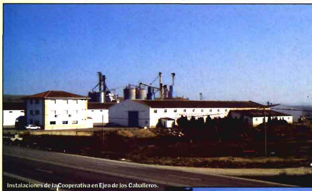
Instalaciones de la Cooperativa en Ejea de los Caballeros.

Situada en la bella Comarca zaragozana de Las Cinco Villas (Sos del Rey Católico, Uncastillo, Sádaba, Ejea de los Caballeros y Tauste), la Sociedad Cooperativa Agraria Virgen de la Oliva es una de las principales cooperativas aragonesas y todo un ejemplo de funcionamiento y buena gestión.