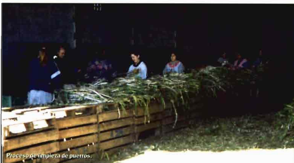
Proceso de limpieza de puerros.

Con todo ello, y siempre teniendo en cuenta lo que quieren los socios y sus necesidades para mejorar la rentabilidad de su trabajo, la Cooperativa Virgen de la Oliva está segura de poder ganar el futuro. ■