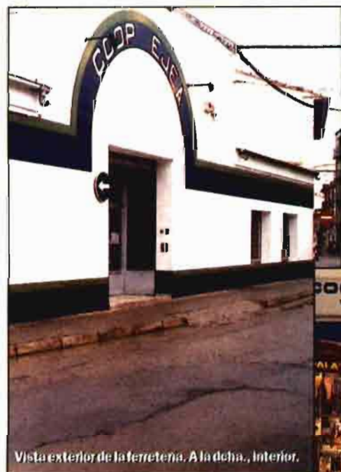
Vista exterior de la ferretería. A la dcha., interior.