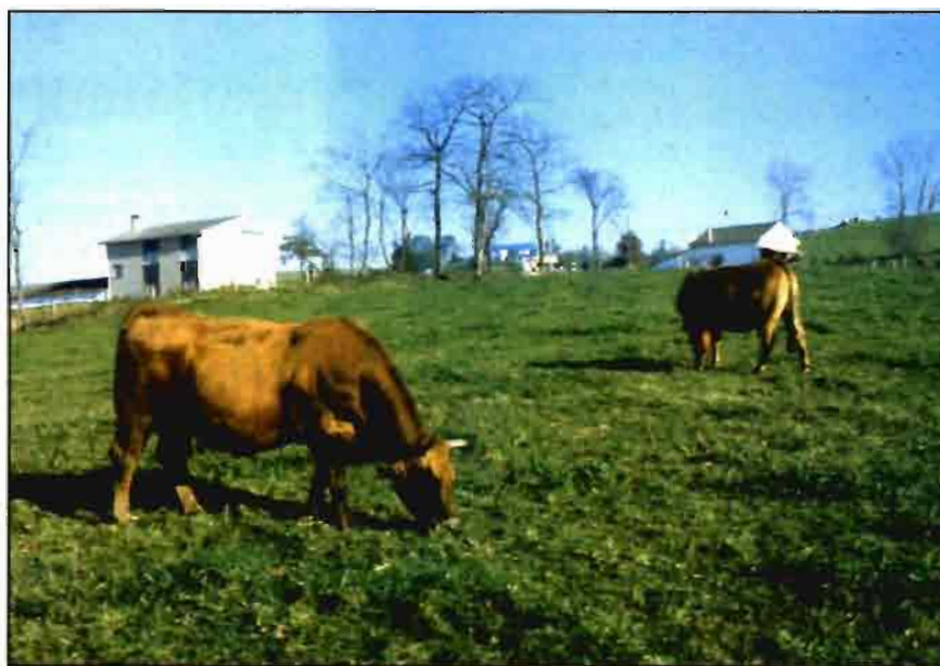
Las indemnizaciones pagadas por el seguro de vacuno alcanzaron los 2.161 millones.

- El seguro de uva de vinificación ha registrado un aumento del 14% en el número de pólizas, 36.925 frente a 32.526 en el Plan 1996. La producción asegurada casi alcanzó los 2.000 millones de kilos (unos 1.600 en 1996) y la superficie, 317.213 ha, fue inferior a la asegurada en la campaña anterior, 355.069 ha. Ocurre todo lo contrario con la uva de mesa, que