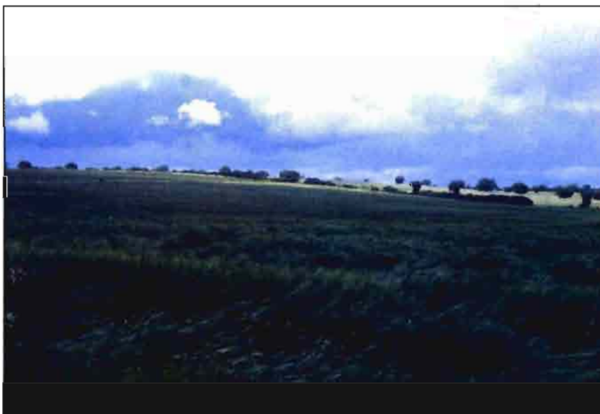
Los riesgos cubiertos por el Sistema de Seguros Agrarios afectaron a más de 1.350.000 ha.

Ha dado inicio el control de las subvenciones adicionales que corresponden a la contratación de los Planes 1996 y 1997. En la actualidad se está preparando la selección de las muestras para solicitar los justificantes que acrediten el cumplimiento de los requisitos establecidos en las respectivas órdenes de subvenciones.