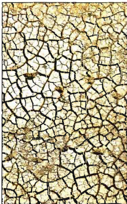
La sequía ha afectado a 447.213 ha aseguradas.

- El riesgo que ha originado un mayor número de siniestros ha sido el pedrisco, con un total de 76.886 avisos y una superficie de 614.984 ha. La helada ocupa el segundo lugar, ya que ha motivado 20.655 avisos y afectado a 181.655 ha. Sin embargo, la sequía, con 14.219 avisos, ha perjudicado a una superficie de 447.213 ha. Por su