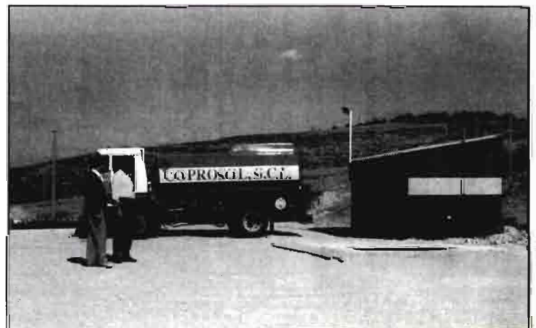
Centro de almacenamiento de Gasóleo B (100.000 litros de capacidad).