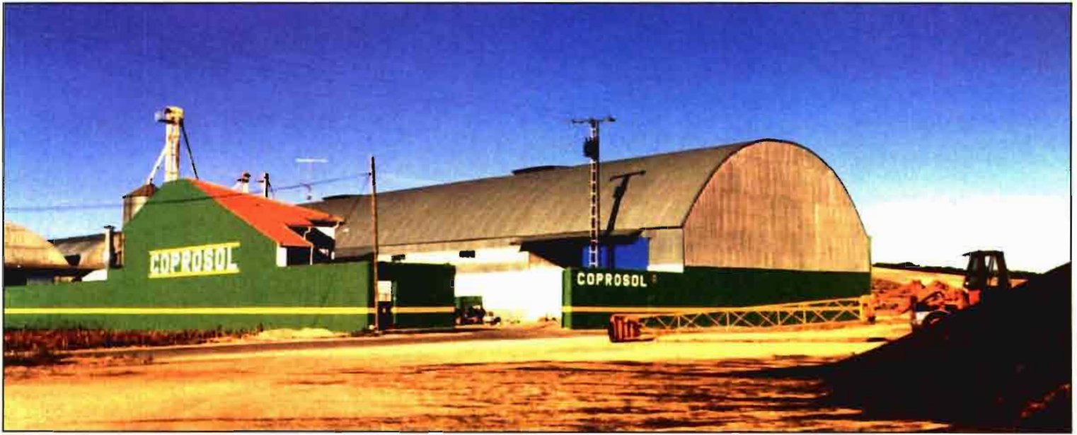
Secadero de girasol y calibrado de cebada en Villares del Saz (Cuenca).

se almacenan en las instalaciones que COPROSOL tiene en Villares del Saz, comenzando el proceso con la recogida del producto en casa del agricultor y transportándolo, posteriormente, hasta estas instalaciones, en donde se acondicionan para ser almacenado. Este acondicionamiento consiste en analizar la humedad, grasa e impurezas y, posteriormente, en pasar las pipas por el equipo de secado y prelimpia. Esto permite tener un producto de alta calidad y mayor valor añadido.