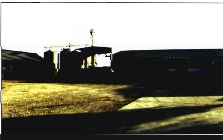
Secadero de girasol y maíz y almacén de cereales.

Resto de servicios. En lo referente a servicios administrativos, COPROSOL tiene a