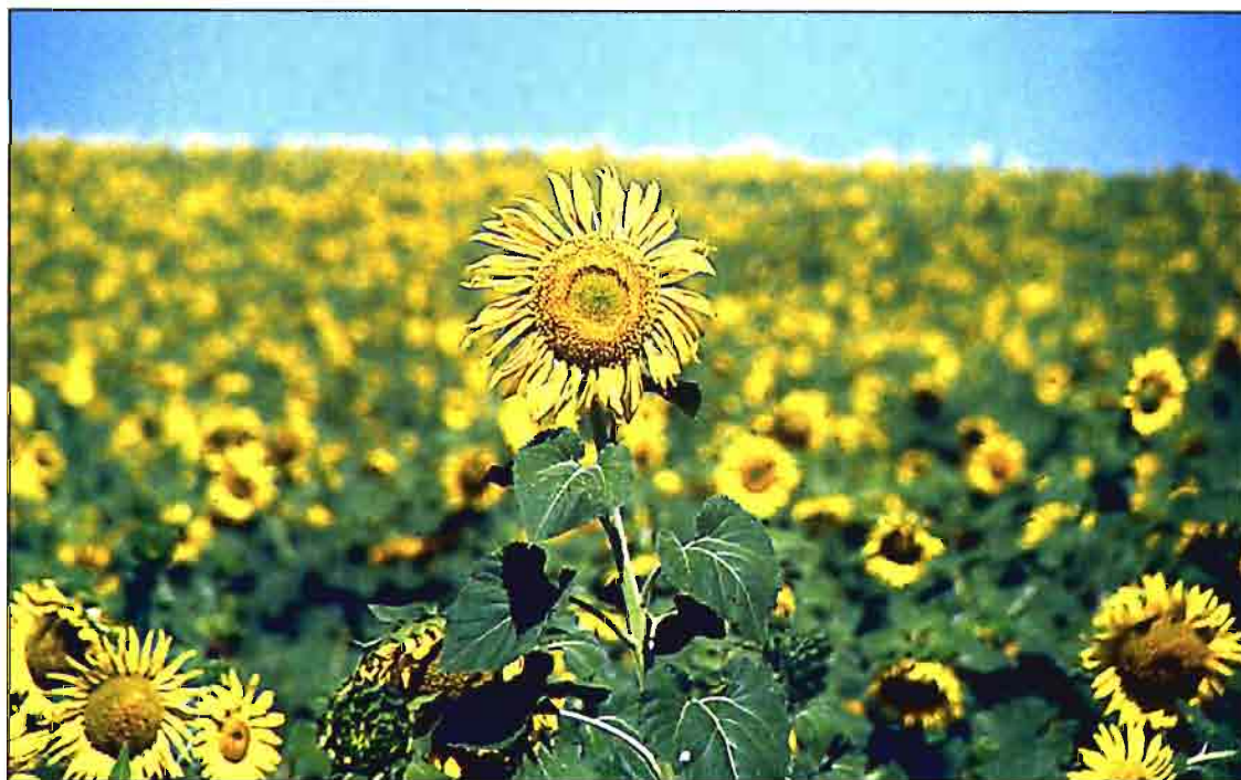
El girasol, la cebada y el maíz son tres de los cultivos más importantes para la Cooperativa.

La distribución y recogida de los productos se realiza a través de transportistas de la zona mediante contratos de arrendamiento de servicios. Además, muchas veces se hace uso de naves y almacenes de los socios, ya que, de lo contrario, no se podría hacer frente al movimiento de mercancías que se produce en cada campaña, debido principalmente a que las instalaciones propias de la Cooperativa están concentradas en Villares del Saz, bastante alejadas de las zonas de producción. Aquí, COPROSOL cuenta con oficinas, naves de almacenamiento, secaderos de pipas y calibrador de cereal. Las oficinas centrales y otros servicios administrati-