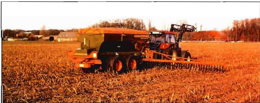
Abonadora arrastrada, polivalente, que puede trabajar como centrífuga de doble disco o como distribuidora mecánica localizadora, de brazos extensibles, como vemos en la fotografía.

El diseño de los discos y las paletas, su velocidad de rotación, el punto de caída del abono sobre el disco, los materiales de