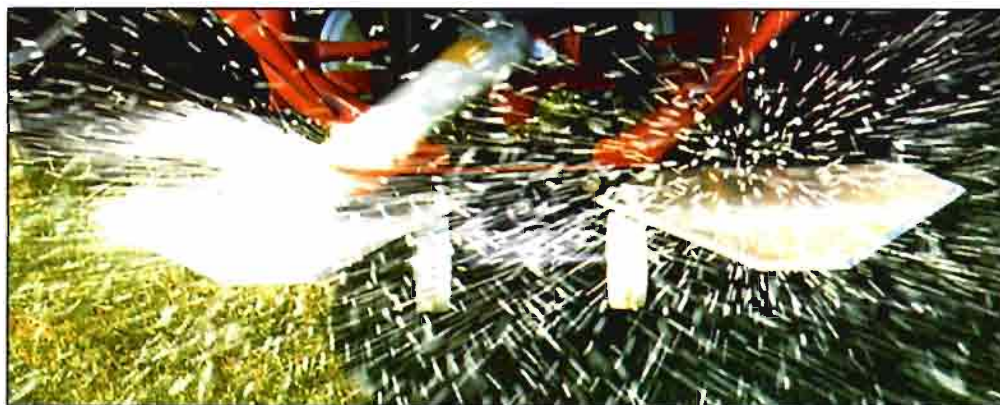
Arriba, la granulometría de los fertilizantes empleados es un factor muy importante para una buena distribución. Granulómetro clásico, de utilización muy sencilla.