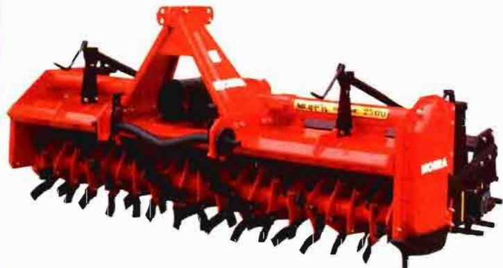
Preparación del terreno