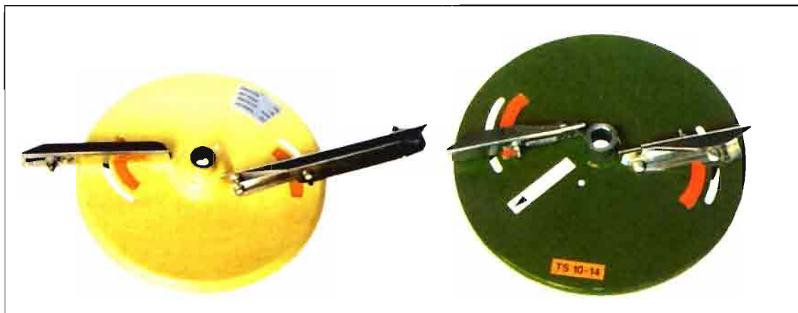
El tipo de disco y de paletas, y la posible regulación de las mismas, es uno de los elementos clave para la eficacia de la distribución.

Por poner un ejemplo, todos somos bien conscientes del carácter fuertemente corrosivo, químicamente, de la mayor parte de los abonos. De ahí la necesidad, ineludible, de limpiar perfectamente la abonadora después de cada utilización y, muy en especial, antes de un largo período de inactividad. Esta norma tan simple, limpiar bien, muy pocos la cumplen. Estamos hartos de ver abonadoras que se dejan tal como se ha terminado la