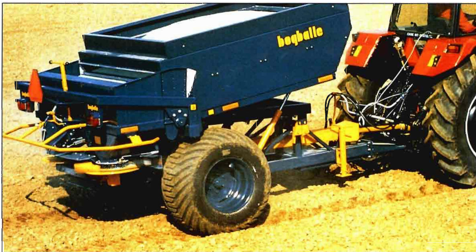
La capacidad de la tolva, la máquina debe ser arrastrada, es un factor fundamental a la hora de decidir el equipo más adecuado a la explotación.

Ello no sucede únicamente en Castilla y León. La misma situación es generaliza-