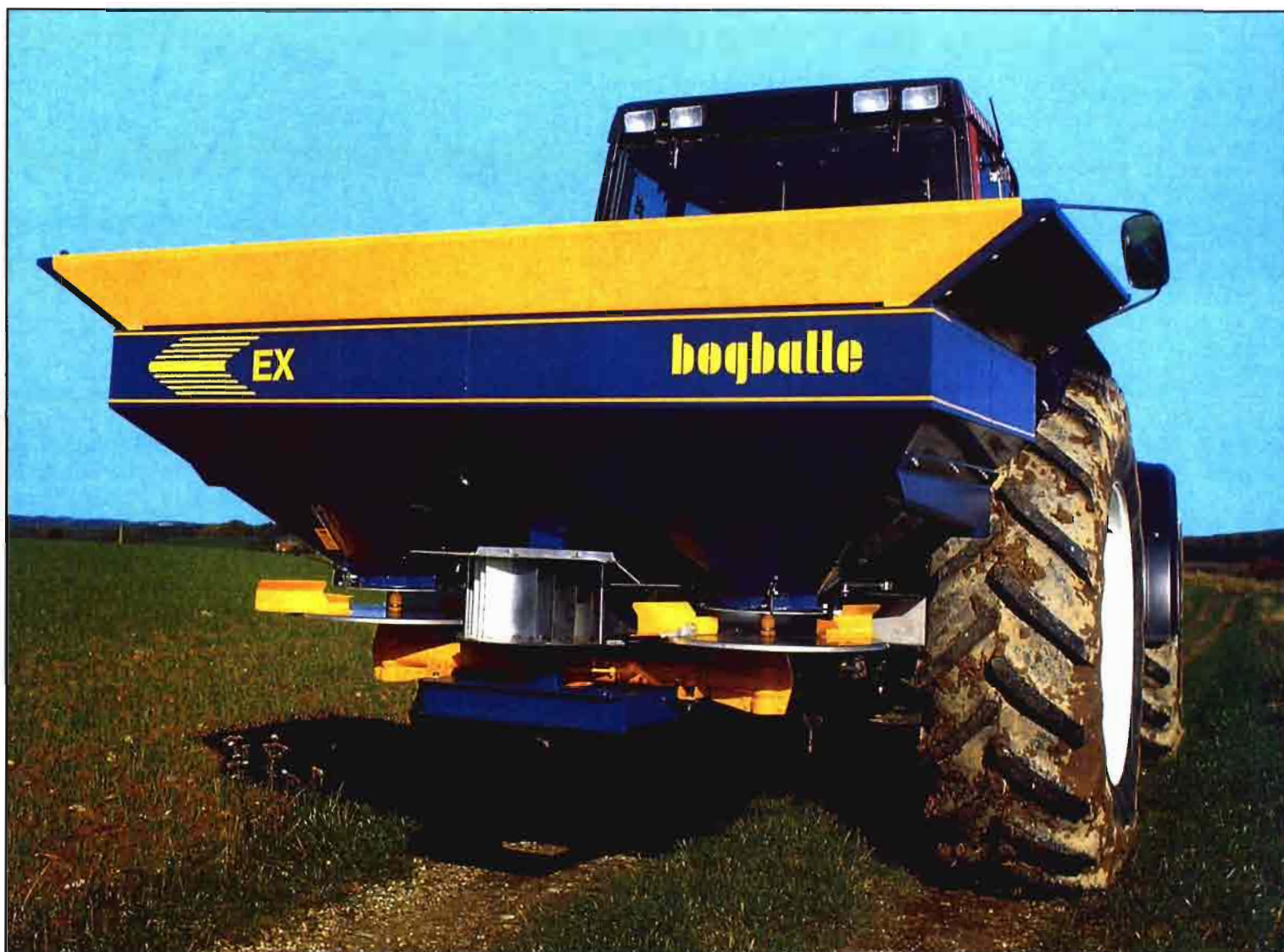
Detalle de un deflector central, en una abonadora centrífuga de doble disco, para una mayor eficacia y regularidad en la distribución.