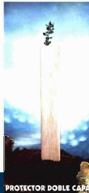
PROTECTOR DOBLE CAPA

Fabricado con lámina de polipropileno color verde tratado anti-UV.