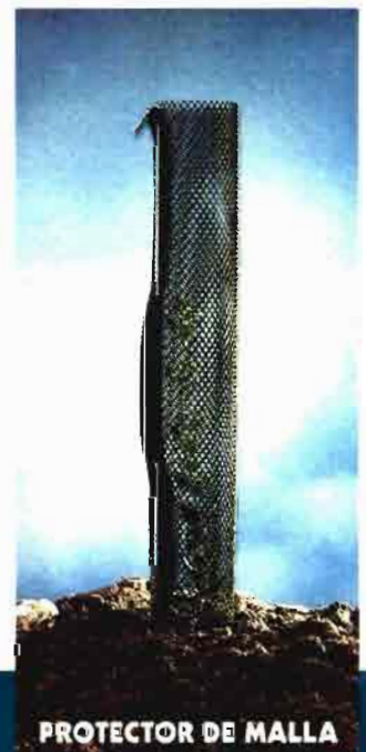
PROTECTOR DE MALLA

Fabricado con placa celular de polietileno de alta densidad y estabilizante UV. Bocardado en la parte superior.