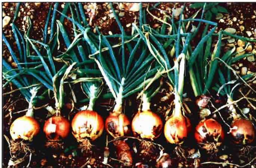
Cada español consume 7 kg de cebollas al año, por término medio.

un color extendido dorado, mientras que las túnicas interiores son blanco-amarillentas, algo sucio. Tiene forma cónica invertida, algo blanda de consistencia y muy jugosa.