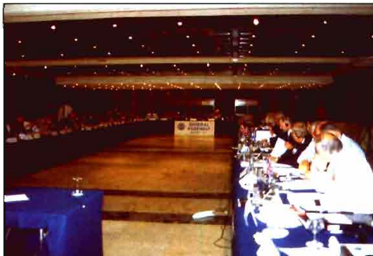
Vista de la Asamblea General del CEMA.

En la presentación de actividades del CEMA se informó a los asistentes sobre el desarrollo de las actuaciones que la asociación ha mantenido con las instituciones de la UE y otros organismos nacionales e internacionales, con el fin de fijar los objetivos de trabajo para este próximo año.