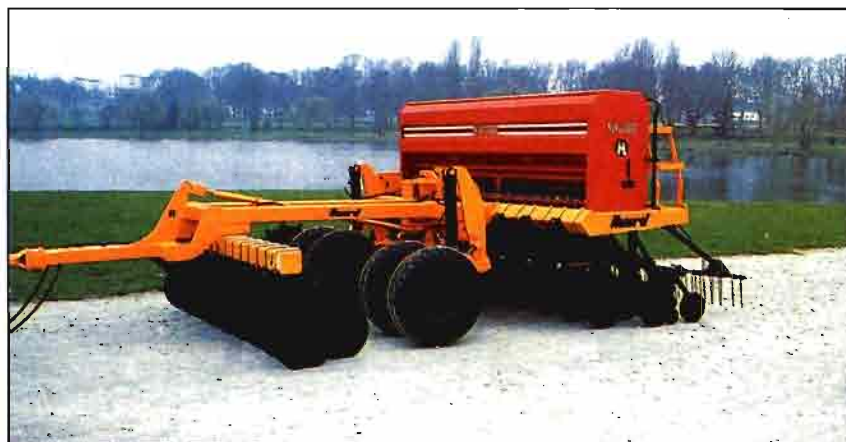
Fig. 4. Discos cortadores montados en bastidor independiente delantero (Kuhn).

mediante la correcta regulación del recogedor de la empacadora, de manera que no queden carriladas que dificulten el corte del suelo y la apertura del surco de siembra. Otra cuestión importante es no dejar proliferar las especies de malas hierbas que aparecen en los períodos entre cultivos, ya que además de los problemas de infestación pueden impedir el funcionamiento de las sembradoras, al enredarse entre los órganos de trabajo, propiciando su embozamiento. Por otro lado, estas especies a las que se ha permitido cumplir su ciclo natural, al ser arrastradas por la máquina durante la siembra, pueden ser causa de posterior propagación. Esta vigilancia ha de ser tanto más exhaustiva cuanto mayor sea el período de tiempo en que el campo se mantiene sin cultivo.