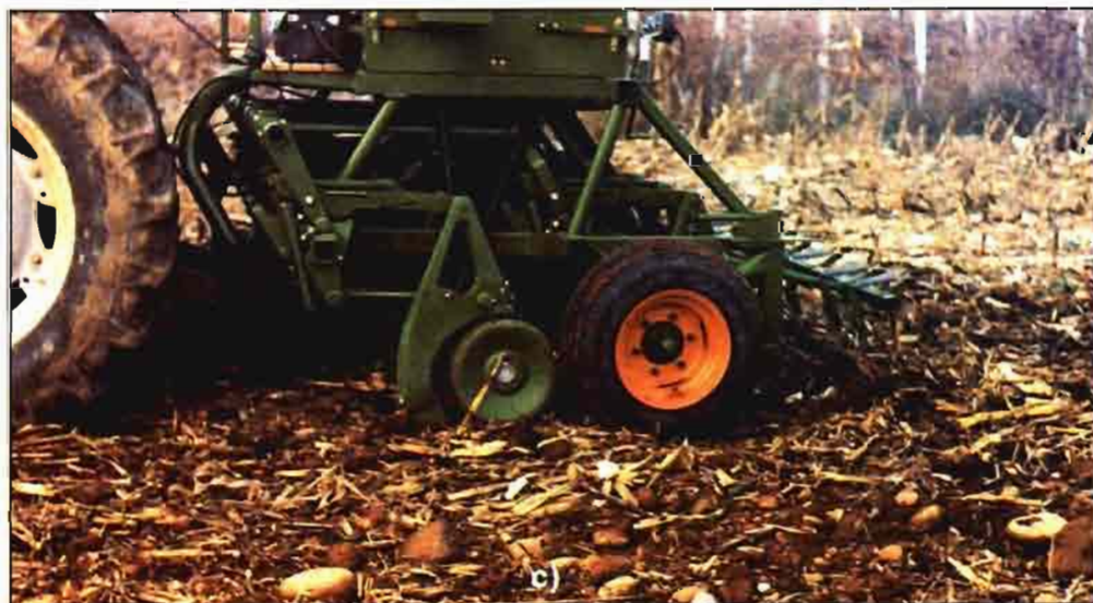
Fig. 6. Sembradoras de rejas: