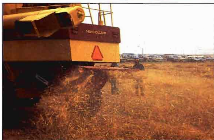
Fig. 2. Picado de paja en la cosechadora (izda.).

sas expectativas entre los usuarios a quienes van dirigidas principalmente estas líneas. La siembra directa ahorra unos gastos comprendidos entre el 10 y 20% respecto de los sistemas tradicionales, pero con la condición de realizar un