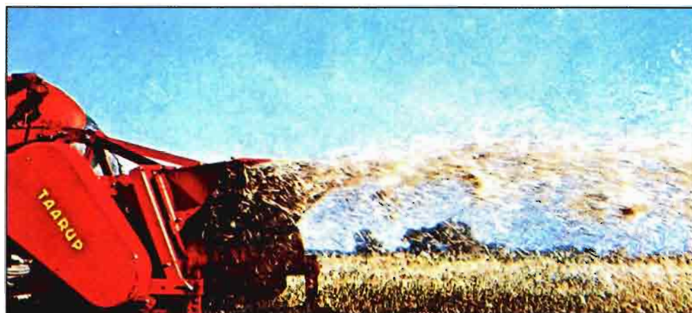
Fig. 1. Picadora de paja (arriba).