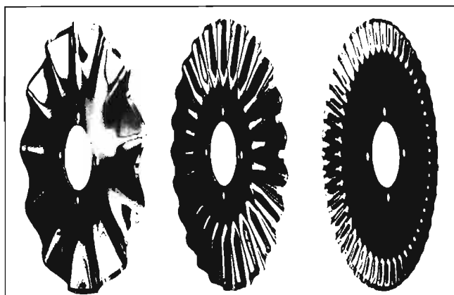
Fig. 3. Discos cortadores de borde ondulado (Great Pains). a) 12 ondas. b) 24 ondas. c) 50 ondas.