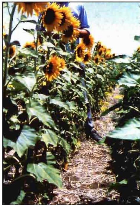
Estado y desarrollo de un girasol de siembra convencional (izquierda) y en siembra directa (derecha).

Efectos nocivos del laboreo. Las labores que tradicionalmente se daban al suelo con los aperos primitivos eran superficiales y poco agresivas y estaban integradas en