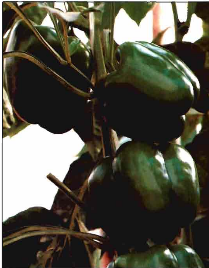
Híbrido F1 de frutos del tipo California con 3 ó 4 cascos bien formados, de pared lisa y gran grosor.

Hasta ahora la polinización de la flor de pimiento se realizaba gracias a la acción del aire, si bien en estudios recientes realizados en las provincias de Almería y Murcia, se ha observado, que tal y como ocurre con el tomate, se mejoran notablemente los rendimientos de estas plan-