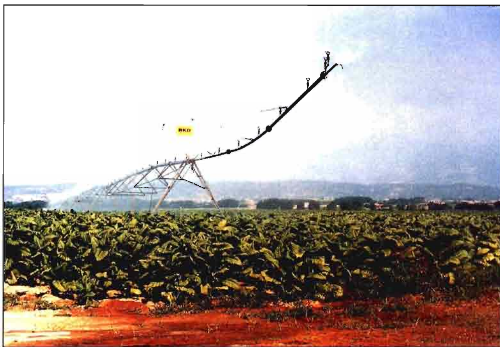
Las explotaciones tabaqueras disponen de las últimas técnicas en maquinaria de riego.

variedades Burley E y F y de 390 ptas. para los tabacos del tipo Kentucky.