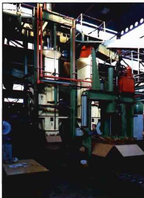
Instalaciones de Cetarsa en Talayuela.

Su capacidad de compra se cifra en 5.000 fardos (bultos de unos 45 kg) diarios, lo que representa casi once millones de kilos a lo largo de la campaña, entre Virginia y Burley, y significa el 26% de la producción nacional. La capacidad de transformación en la línea «A», o de batido, es de 6.000 kg/h, con la consecución de estándares y especificaciones de los más exigentes clientes nacionales e internacionales. La capacidad de procesado de