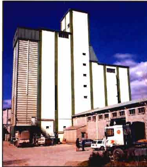
La ganadería es la actividad agraria predominante en Cataluña.

En lo que se refiere a la producción agraria, y a pesar de que el escaso espacio disponible y la falta de datos estadísticos actualizados (en el momento de escribir