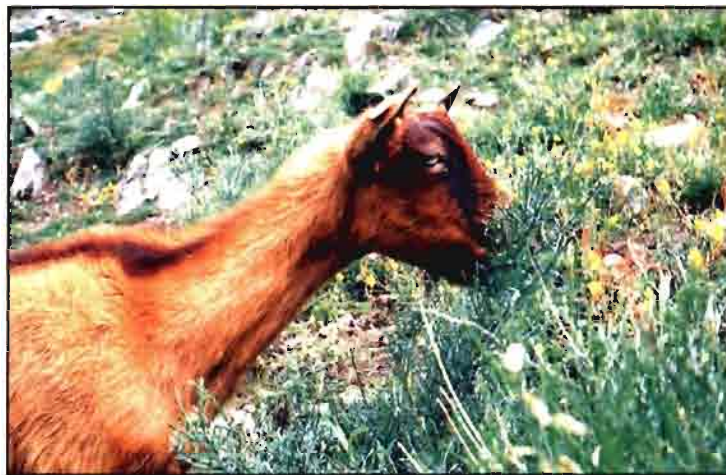
Se alcanzaron unos precios excelentes en ovino y caprino.

Sin embargo, y a tenor de la cosecha de uva registrada este año que, según datos del consejo regulador, supera ampliamente la de 1995, y teniendo en cuenta los precios medios de uva alcanzados (115 ptas./kg precio medio de uva tinta) inducen a pensar que el vino