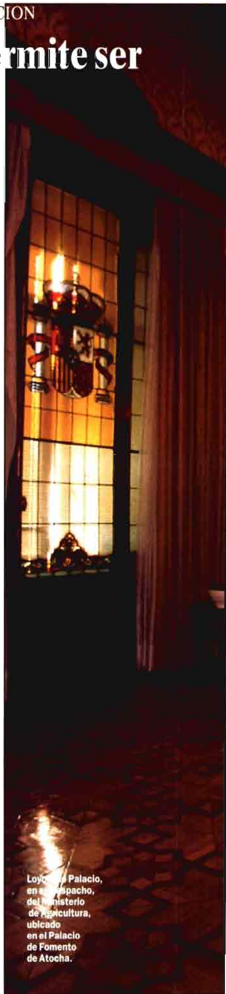
Loyola de Palacio, en su despacho, del ministerio de Agricultura, ubicado en el Palacio de Fomento de Atocha.

«Hemos acudido a Bruselas exigiendo que España tenga la importancia que merece en Agricultura y Pesca»