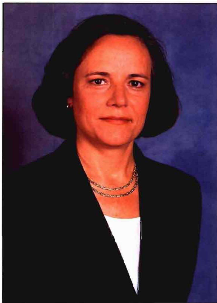
Loyola de Palacio, ministra de Agricultura.

¿Qué es necesario y urgente que la UE nos asigne más cuota? Indudablemente. Seguimos reclamando el millón de toneladas que nos hace falta. Y hay que conseguirlo. Pero sabiendo que también hay cosas que poner de nuestra parte.