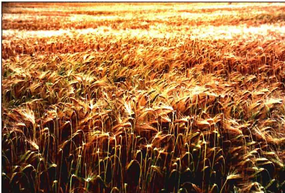
Castilla y León produce el 40% de los cereales nacionales.

Conviene recordar que la Producción Final Agraria ha pasado de 371.000 millones de pesetas en 1984 a unos 500.000