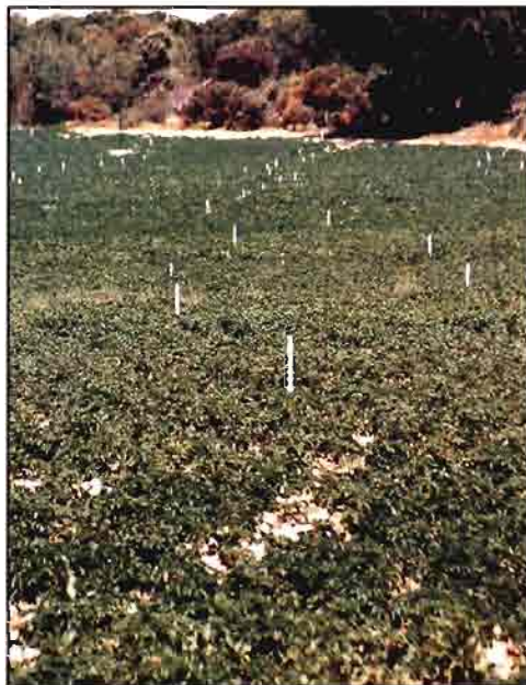
La patata es el cultivo más importante de Baleares.

Durante el presente año, y a pesar de la disminución que en patata temprana han provocado los fuertes vientos, la cose-