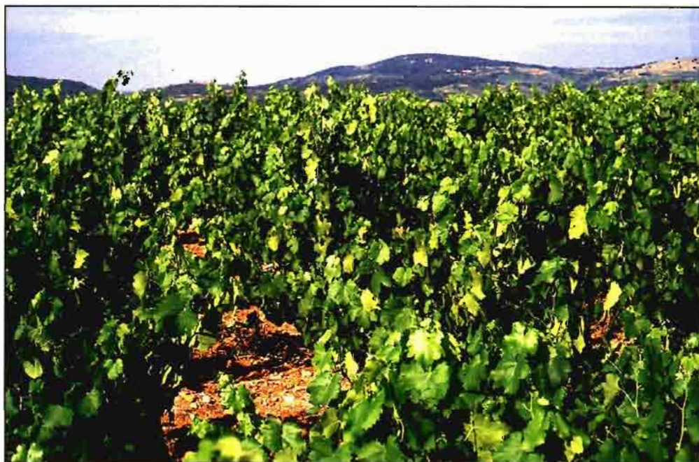
Hortofruticultura y viñedo son producciones importantes en Aragón.

Pero esta abundancia, aunque desigual entre las tres provincias aragonesas, ya que la pluviometría y otras condiciones climatológicas han mostrado marcadas variaciones, no está siendo enteramente positiva para el sector. La evolución de la oferta y la demanda rigen las tendencias del mercado, por lo que este año los resultados productivos han traído a su vez un descenso de los precios, en especial de la cebada y el trigo que a lo largo del año han caído en torno a las cinco pesetas.