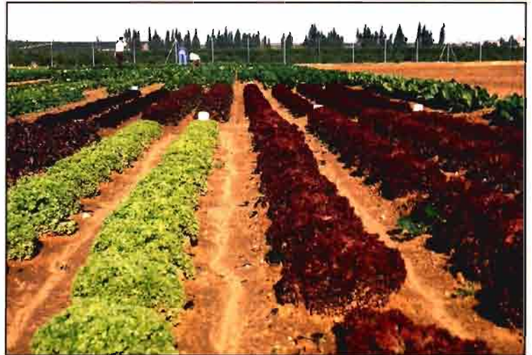
Con la OCM de Frutas y Hortalizas se vulneró la solidaridad financiera.

El sector lácteo español está viviendo uno de sus peores momentos debido a la superación de la cuota asignada al Estado español, lo que supone una penalización a los ganaderos de más de 7.000 millones de pesetas. La COAG ha liderado las movilizaciones contra el pago por parte de los ganaderos de una multa tremendamente injusta. El principal problema es la insuficiente cuota que