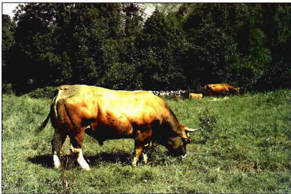
Se conceden ayudas a los ganaderos de vacuno.

El Príncipe de Asturias inauguraba el día 18 en Sevilla la 75 Reunión del Con-