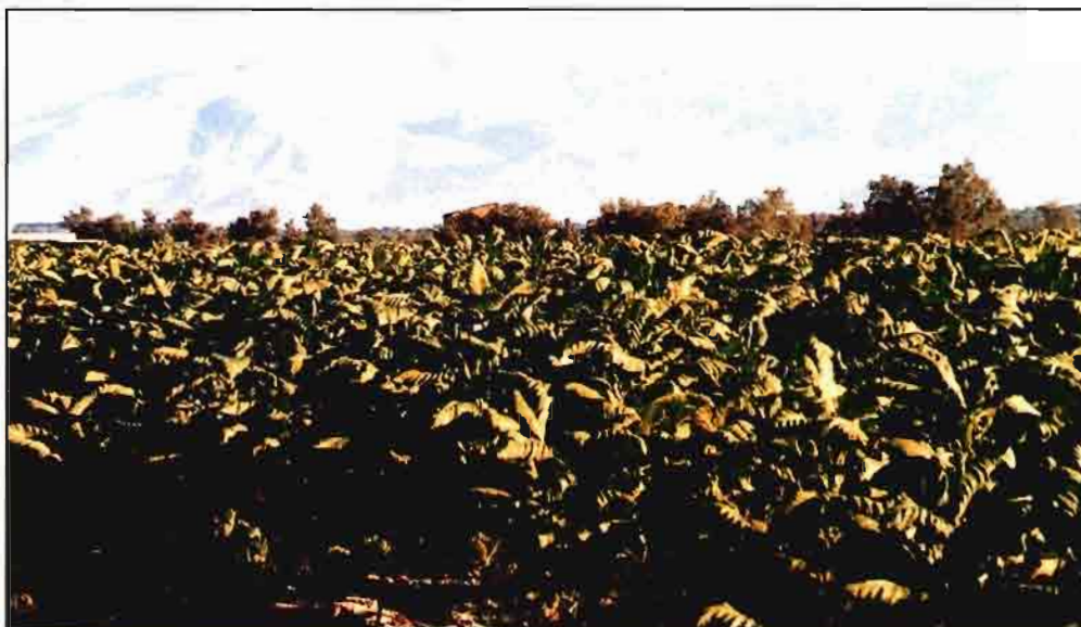
Las perspectivas de la campaña de tabaco son excelentes.

Así, trigo y cebada sumarán al final de campaña una producción total que superará las 420.000 t, mientras en girasol se podrían alcanzar más de 95.000 t, sin olvidar los cultivos leñosos, donde la producción de vino y mosto podría ser todo un récord. Además, la aceituna de mesa y la producción de aceite tampoco desentonarán durante la actual campaña.