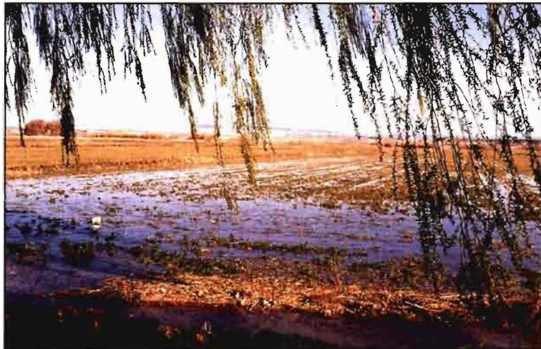
Enero de 1996 ha sido uno de los meses más lluviosos del siglo.

La presidencia de la Comunidad, ejercida durante este primer semestre por Italia, parecía tener especial empeño en sacar adelante la reforma de la OCM del aceite de oliva, mientras daba largas a la contro-