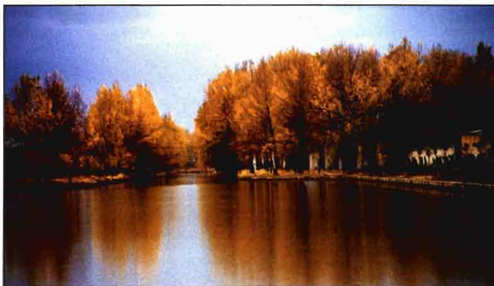
El Plan Nacional de Regadíos llegó al Consejo de Ministros.

derecho a retirada y un período transitorio más largo) devolvía la esperanza a los agricultores y a sus organizaciones de representación.