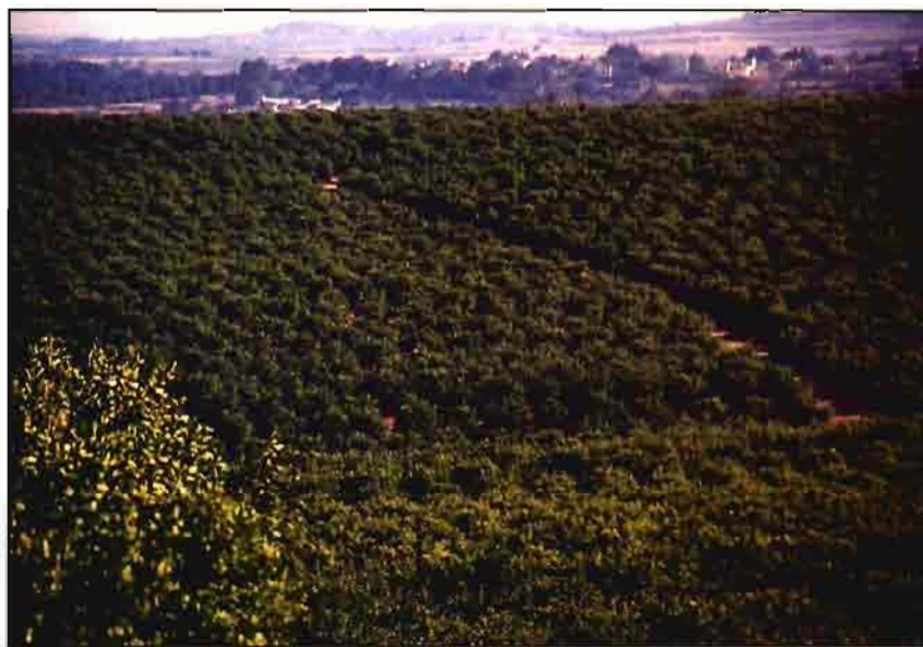
Los problemas sanitarios mermaron la cosecha de cítricos.

lluvias primaverales. Otro producto de gran relevancia en la agricultura valenciana, la uva de mesa, ha dado resultados satisfactorios (244.000 t), a pesar de los problemas causados en la variedad Moscatel Ro-