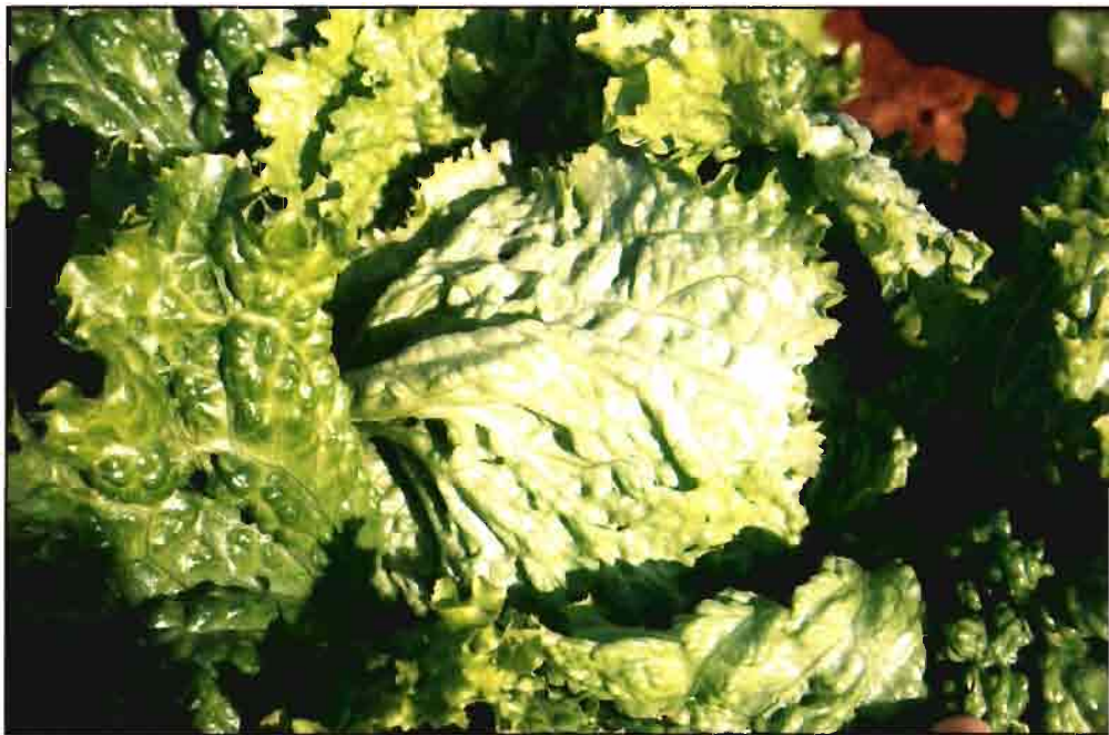
Buenas cosechas en melón y lechuga, también en tomate y brócoli.

ducción, con un 25-30% de incremento sobre la cosecha de 1995 según especies (albaricoque, melocotón y ciruela), debido a las mayores disponibilidades hídricas y ausencia de pérdidas por helada y pedrisco.