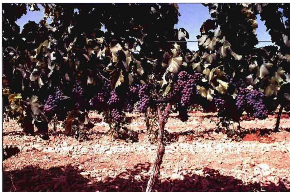
La uva ha llegado a la vendimia en buen estado y en un punto de maduración ideal.

Los precios orientativos que se barajaban eran de 3 ptas./kg para la uva blanca y entre 5 y 5,25 ptas./kilogramo para la tinta, aunque en el caso de la primera se decidió primarla con un grado más en la primera semana, para incentivar a los agricultores.