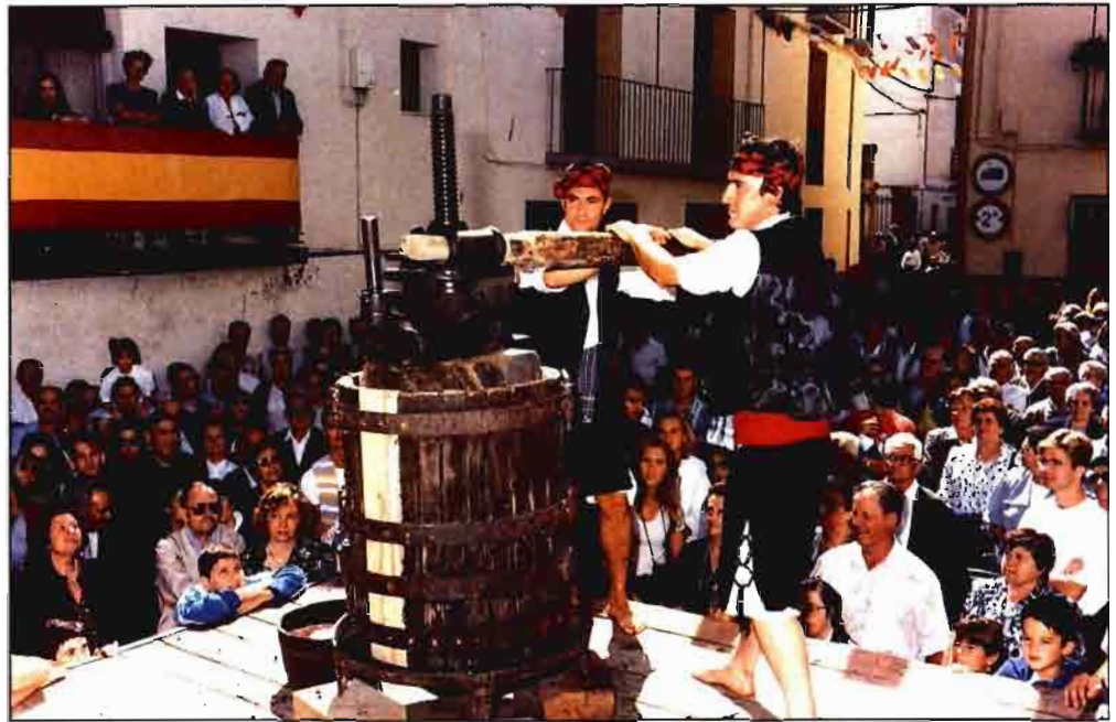
En Cariñena (Aragón) la cosecha de uva es media, aunque de una gran calidad.

Los análisis que se realizan, dentro del