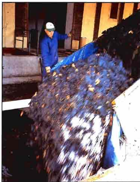
La producción final alcanzará casi los 29 millones de hectolitros.

Por lo que se refiere a la Denominación de Origen «Campo de Borja» los técnicos del Consejo Regulador hablan de una cosecha de entre 20 y 21 millones de kilos de uva, cifra con la que se volvería a los volúmenes normales en esta zona de