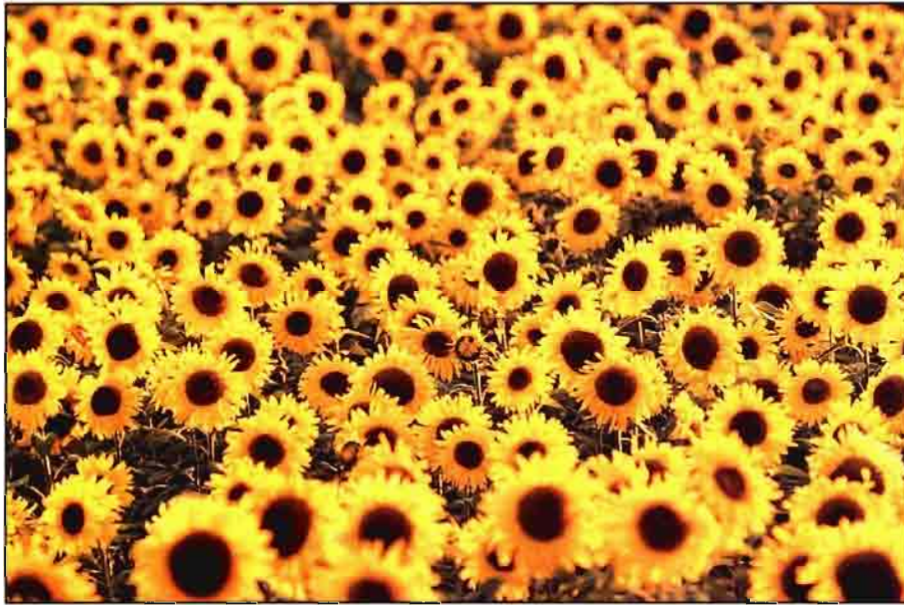
Tres de las principales actividades de UTECO son la producción de maíz (foto superior derecha), cereales (foto superior izquierda) y girasol (foto inferior). Las tres actividades movieron más de 5.000 millones de pesetas en 1995.