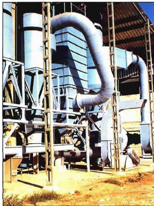
Vista exterior de una fábrica deshidratadora de alfalfa.

En definitiva, mejorar la estructura y dimensión de Uteco, para hacer una empresa comercial, rentable y competitiva. ■