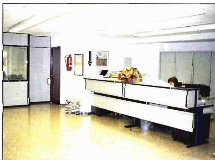
Vista de las oficinas centrales.