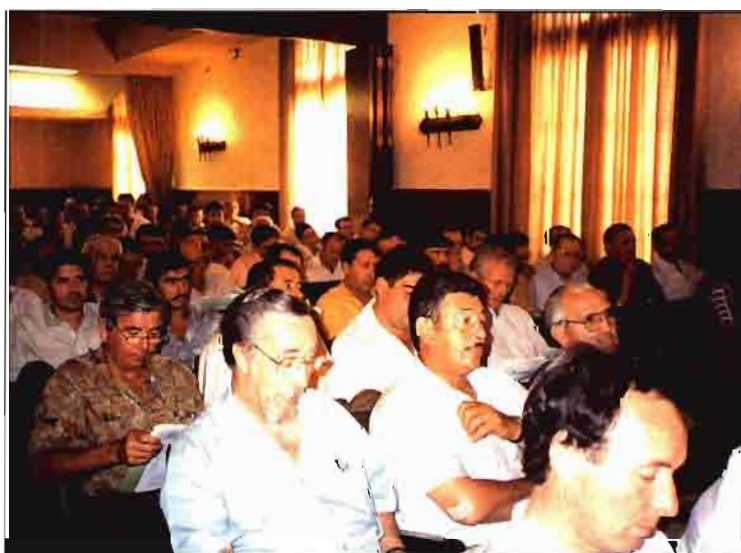
Imágenes de la Asamblea General de UTECO de Zaragoza.