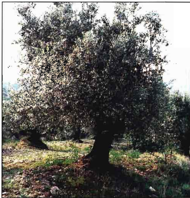
Las secciones de olivo y almendros son también muy destacadas, estando UTECO reconocida como Organización de Productores en ambos casos.