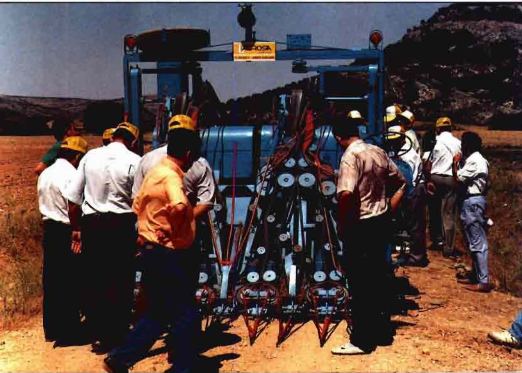
Arrancadora de lino textil en una demostración (visión frontal).

se ha reflejado una progresión de sembradoras de chorrillo con una intensidad aproximada de una máquina por cada 56 ha, frente a una máquina por cada 461 ha en las monograno, es decir que en este segundo caso hay un uso colectivo que está impidiendo la sobremecanización que decíamos anteriormente.