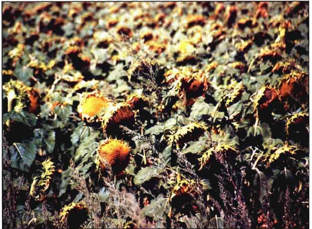
A. DE LAMO

Quiénes así opinan no están en contra de las subvenciones, lo que no tendría sentido, sino de los efectos perversos que le atribuyen. Piensan que con las subvenciones los agricultores pierden estímulos a