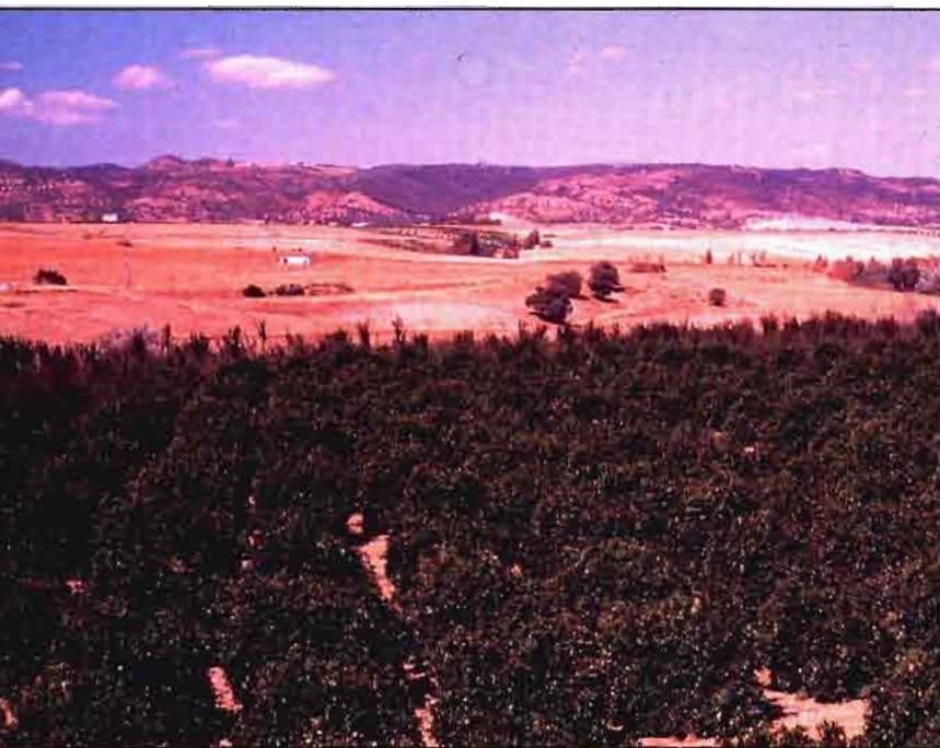
A. DE LAMMO

Estas conclusiones ofrecen luces y sombras y no podía ser de otra manera dada la complejidad de integrar la agricultura española en la CEE/UE y de todos los intereses en juego. ■