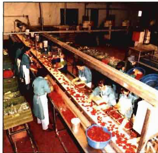
Acorex ha creado la sociedad anónima IVEXSA (Industrias Vegetales Extremeñas) que fabrica 1.000.000 kg de espárragos en conserva, 500.000 kg de pimiento de piquillo y 400.000 kg de melocotón en almíbar.

ración de productos terminados de cerdo ibérico.