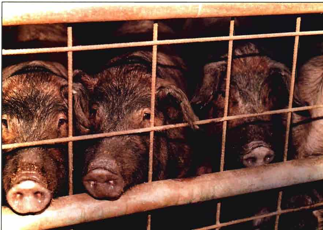
Se realiza una selección genética de ganado porcino Ibérico con la finalidad de conseguir un producto de máxima calidad.

vés de Anecoop frutas y hortalizas desde el año 1986.