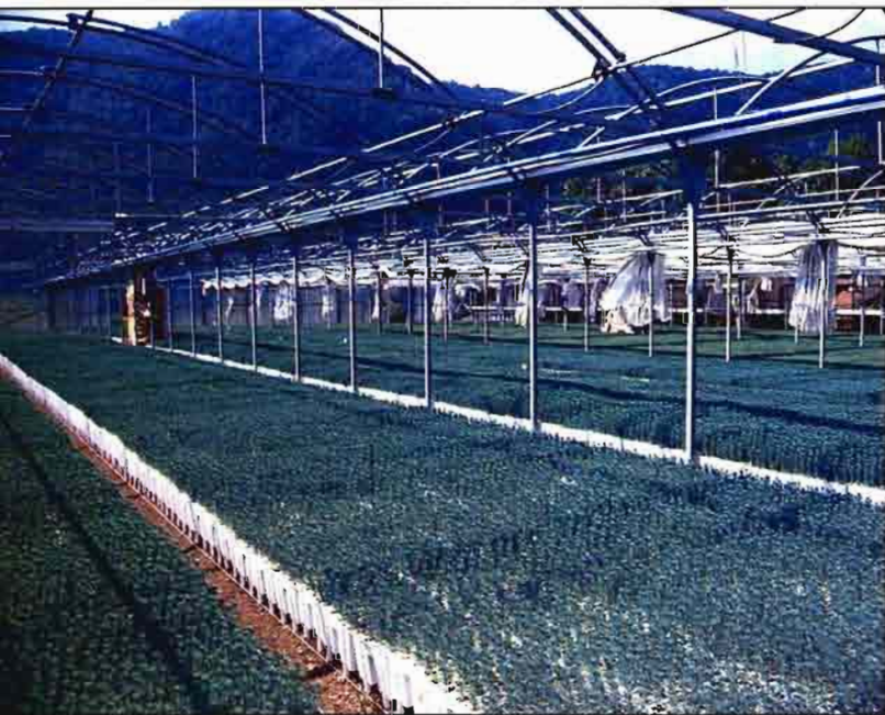
Aunque una especie sea adecuada al clima no es suficiente para su desarrollo.

Concluida así la segunda fase se dispone de una adecuada selección de especies que pueden vivir en el monte a repoblar y entre las que es posible realizar una acertada elección en la tercera fase. No es infrecuente en proyectos de repoblación forestal en España que la lista referida se haya reducido a una sola especie en este momento, por lo que es equivalente selección y elección. La causa suele ser la intensa sequía estival de muchas zonas combinada con unas condiciones edáficas