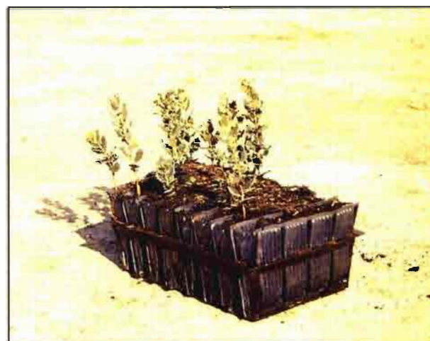
Hay que instalar masas que además de persistir, cubran algún objetivo productor o protector.

El concepto de especie es sistemático y hace referencia a una constancia, dentro de cierto grado de variabilidad, morfológica de los individuos que a ella pertenecen y que dentro de unos ciertos límites se corresponde con un comportamiento fisiológico frente al biotopo, todo lo cual sirve para estudiar los caracteres culturales de las especies y especialmente lo relativo a la estación. Subgrupos de individuos dentro de una especie presentan diferentes comportamientos frente a situaciones estacionales constantes, lo que da lugar a categorías sistemáticas tales como: subespecie, variedad, forma, raza, etc... En repoblación forestal, además de elegir entre las categorías sistemáticas anteriores, se debe llegar a concretar el ecotipo o procedencia, es decir, hay que indicar la masa de la que deben provenir las semillas que darán origen a las plantas de la masa que se pretende crear, de forma que no sólo se realice una homologación detallada de los factores ecológicos entre el lugar de procedencia e introducción, sino que se puedan establecer previsiones respecto de las características de la masa