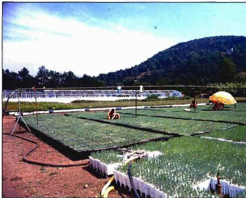
En repoblación forestal además de determinar la especie hay que definir su ecotipo.

En relación con los factores fitosociológicos, la composición florística actual del terreno a repoblar suministra información respecto de: condiciones estacionales a través de la presencia de especies indicadoras cuyo conocimiento complementa el estudio climático y edáfico realizado anteriormente; la asociación vegetal climática que corresponde en la sucesión primaria a la zona a repoblar; y el estado de degradación de la vegetación o etapa de la sucesión secundaria en que se encuentra el monte.