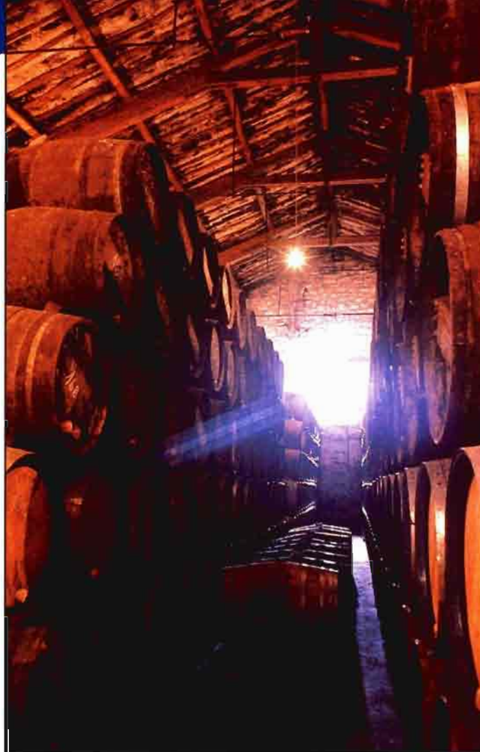
El consumo de vino y mosto retrocedió, en 1994, un 5,5% con respecto al año anterior.

A pesar de esas importaciones, de la fuerte reducción en la producción de mosto y de la disminución de las exportaciones españolas de vino, se produce una baja de los stocks finales de campaña que va a seguir presionando al alza en los precios. ■