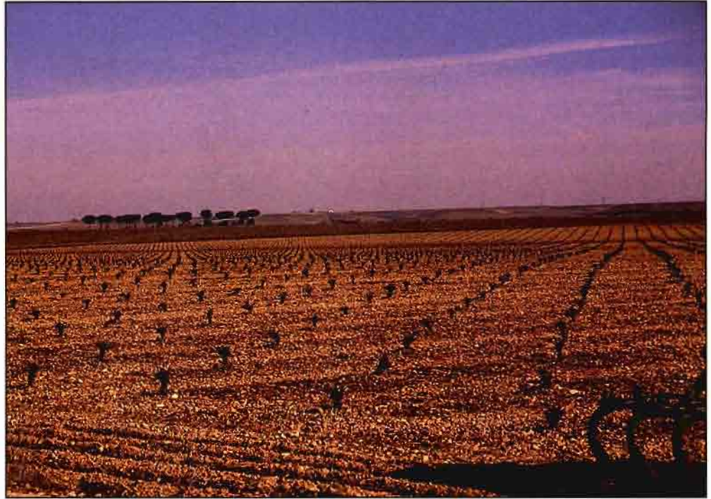
En España, se han arrancado desde el año 1988 cerca de 200.000 ha de viñedo.

Dentro de la evolución de las exportaciones españolas de vinos tranquilos en 1994 resulta también reseñable su evolución por destinos geográficos y especialmente el hecho de que el pasado año, en la práctica, sólo han crecido las exportaciones de vino embotellado a la Unión Europea y a los otros países europeos occidentales. Por contra, han descendido los envíos de vinos tranquilos a granel a todos los destinos geográficos y su causa hay