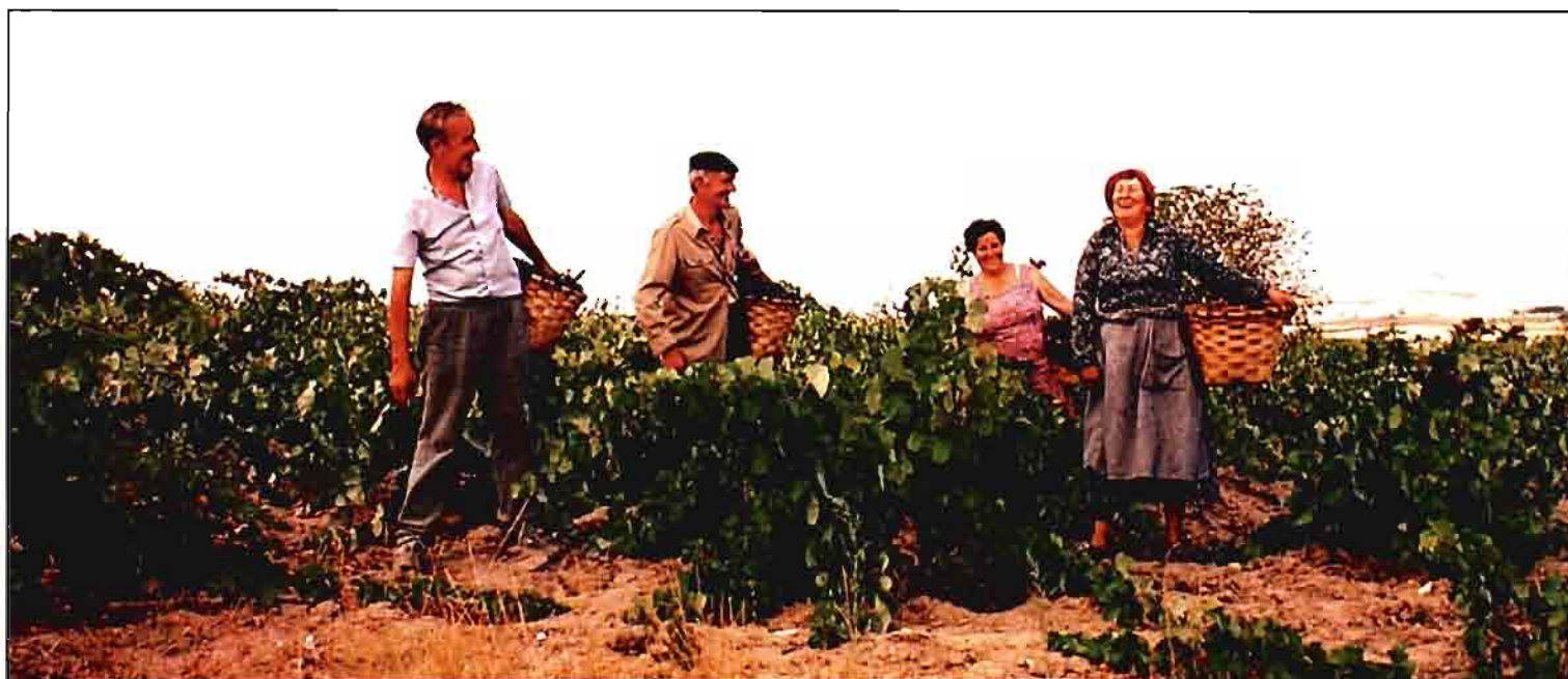
La producción de vino y mosto de 1994 es la más baja de los últimos 30 años.

Con esa peor evolución, el vino ha perdido participación y ha pasado a ser el 7,7% del total de exportaciones de productos agrícolas y el 1,3% del conjunto de todas las exportaciones españolas, frente al 9% y 1,5% del año anterior (cuadro VII).