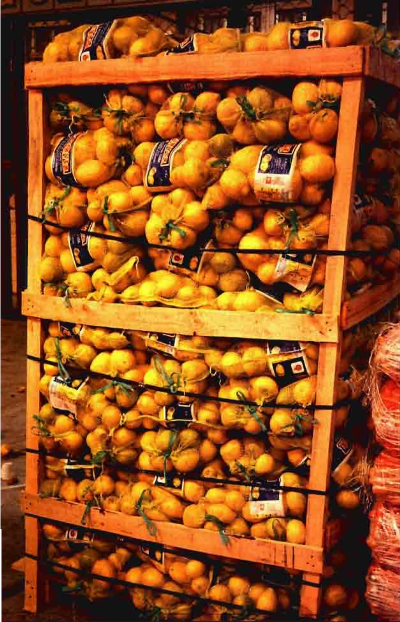
En frutas y hortalizas se prioriza la selección, clasificación y envasado.

una denominación geográfica, de acuerdo con la orden de 11-XII-1986.