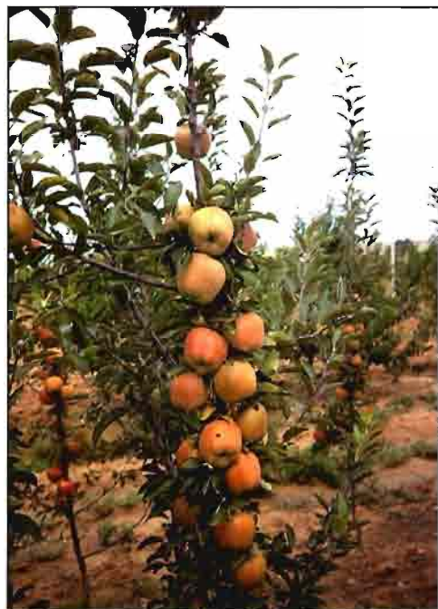
Formación en cordón vertical sin estructura de apoyo, recomendada para «alta densidad».