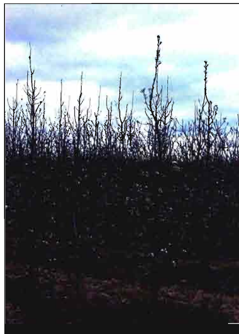
Forma en huso, aplicada al peral en «alta densidad».