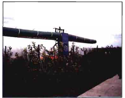
Equipos de tratamiento recomendables en «alta densidad».