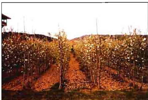
Plantación en «alta densidad» a marco de 1,50x0,50 m (sobre 12.000 árboles/ha).

«Spindle», aplicado al manzano en «alta densidad».