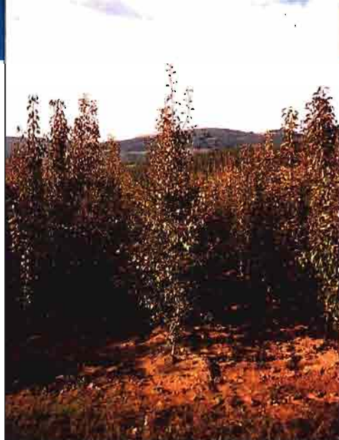
Peral M. Aremberg/B.A. 29 en «alta densidad». Setos ramificadas que densifican el bloque.

Las variedades de manzano con mejor comportamiento agronómico en «alta densidad», mayor productividad acumulada y mejor respuesta a la aplicación del Cultar, han sido en nuestros ensayos el grupo