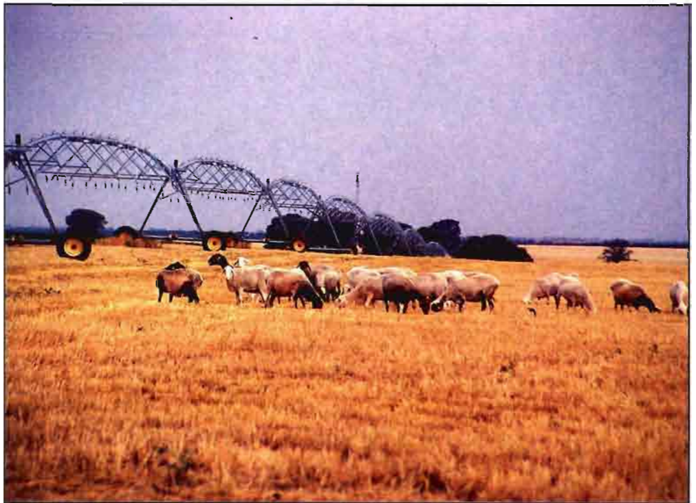
Junto a cereales, vino y ganado ovino destaca también la producción de girasol y aceite de oliva.

En una primera aproximación a las diversas situaciones que podemos encontrar en Castilla-La Mancha (que es susceptible de una mayor aquilatación y concreción), podríamos distinguir cuatro tipos de zonas rurales donde podrían tener encaje, a efectos de unos esquemas de tratamientos y enfoques de posibles actuaciones, la práctica totalidad de comarcas de la región. Estas cuatro zonas tipo serían: Zonas rurales con predominio de la riqueza forestal y medioambiental, zonas rurales fundamentalmente agraria,