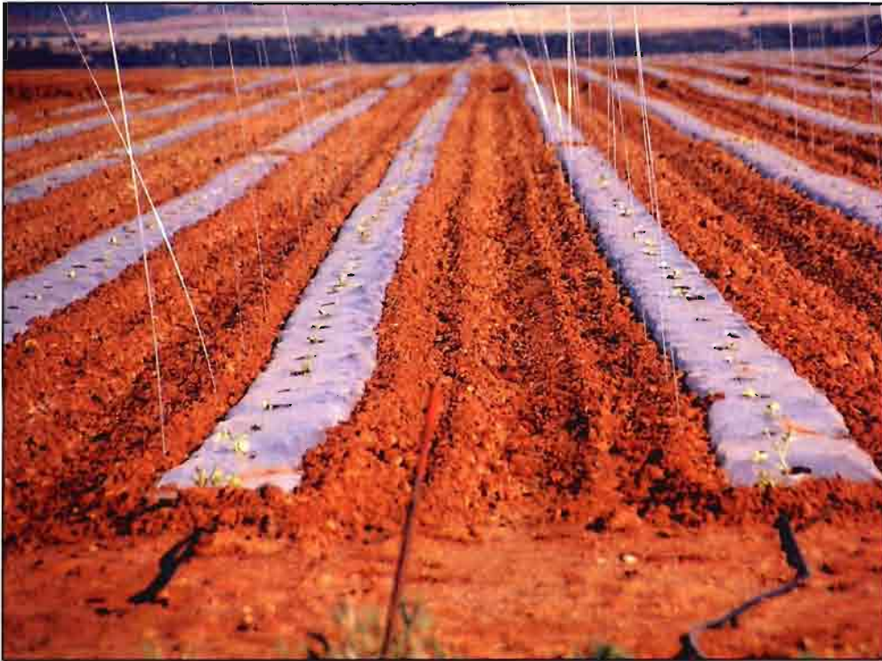
Sólo el 8% de la tierra cultivada es de regadío.

hora de planificar y ejecutar el desarrollo rural, lo siguiente: