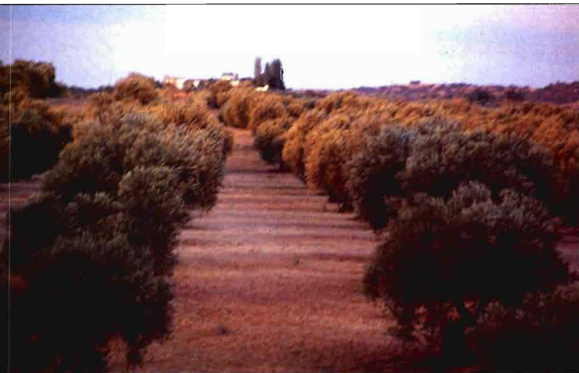
El peso de las cooperativas agrarias es importante en la región.

Estas distintas realidades, en la tipología de nuestro mundo rural, con necesidad de actuaciones que aborden su problemática, plantean una clara necesidad de establecer programas comarcales de desarrollo