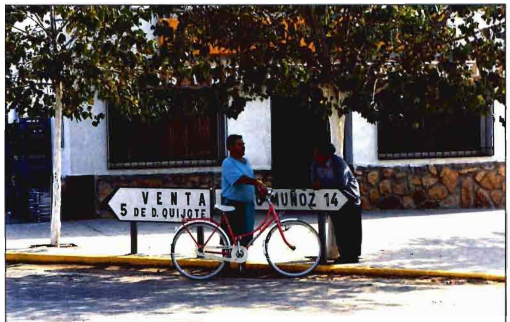
La ruralidad de Castilla-La Mancha es patente.

De especial importancia para el sector agrario regional ha sido el alto nivel de inversiones en industrias agroalimentarias y