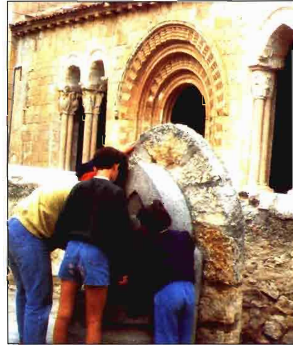
Muchos proyectos Leader giran en torno al turismo rural.

El programa Leader I ha representado una inversión, entre pública y privada, de 1.155 millones de ecus (442 millones procedentes de la UE, 347 de los Estados miembros y 366 de los actores económicos locales). El presupuesto medio de un programa Leader ha estado cerca de 5,3 millones de ecus. Los proyectos han girado, básicamente, en torno a cuatro grandes bloques: turismo, valorización de productos agrarios, pequeña y mediana empresa y artesanía, apoyo técnico al desarrollo rural y la formación. Han accedido al programa Leader I un total de 217 proyectos (127 para las regiones del Objetivo 1 y 90 para las zonas del Objetivo 5b). España, con 52 Leader, es el país de la UE con un mayor número de proyectos apro-