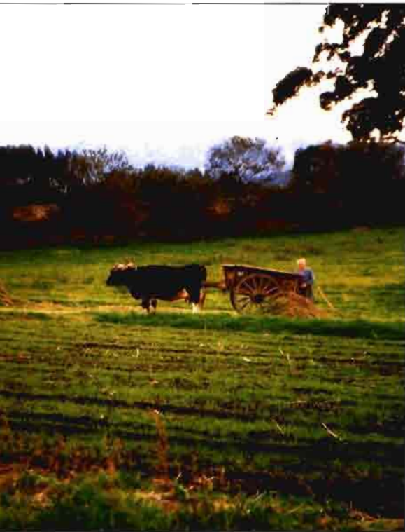
Con los programas Leader se pretende el desarrollo local

El Leader II otorgará ayuda financiera (Cuadro I) a dos categorías de beneficia-