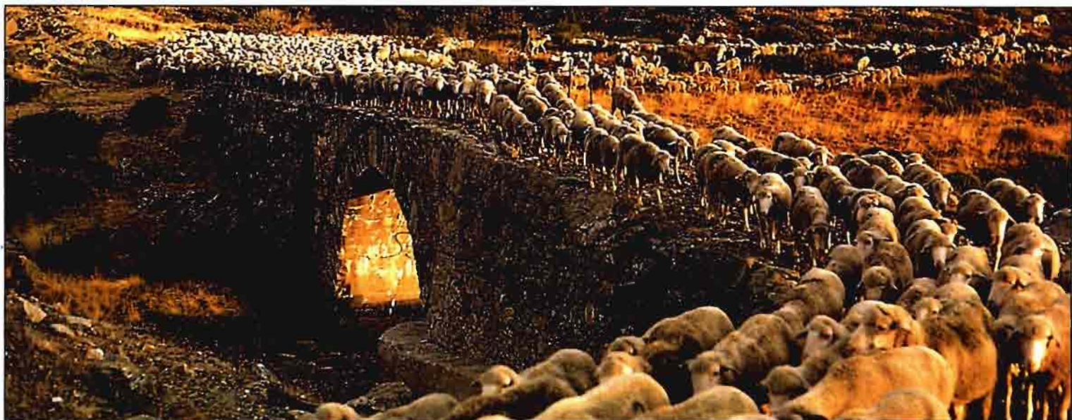
Llegada de un rebaño a Puente Porto, en Sanabria (Zamora), después de realizar un largo recorrido por las vías pecuarias.