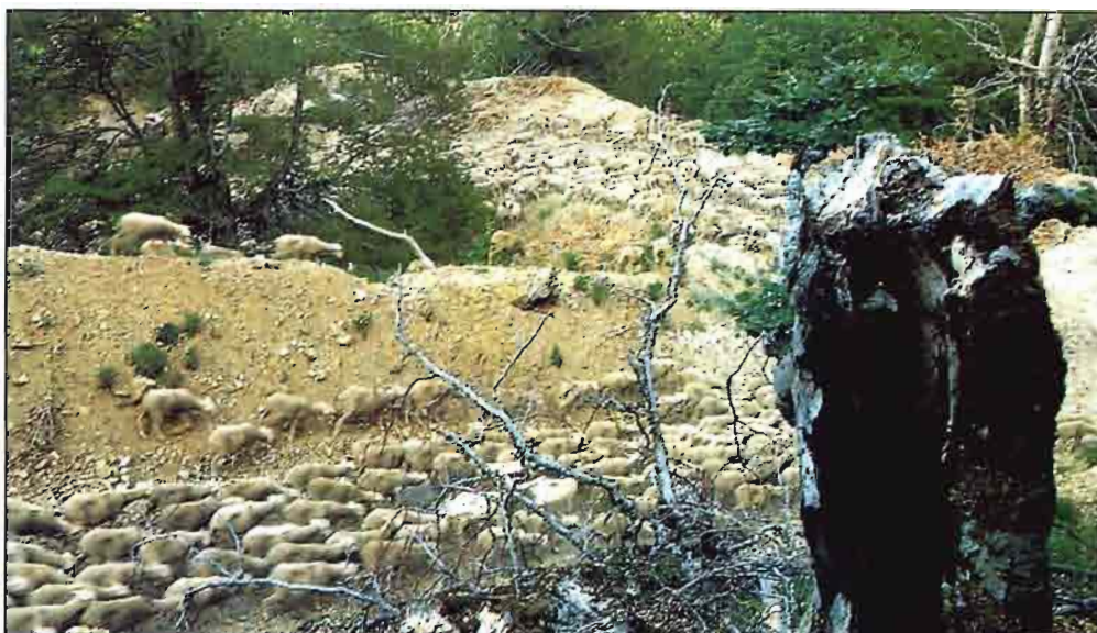
Las ovejas pasan entre unas escombreras que han destrozado la ruta transhumante. La Remolina (León).

degradación que no ha remitido hasta nuestros días.