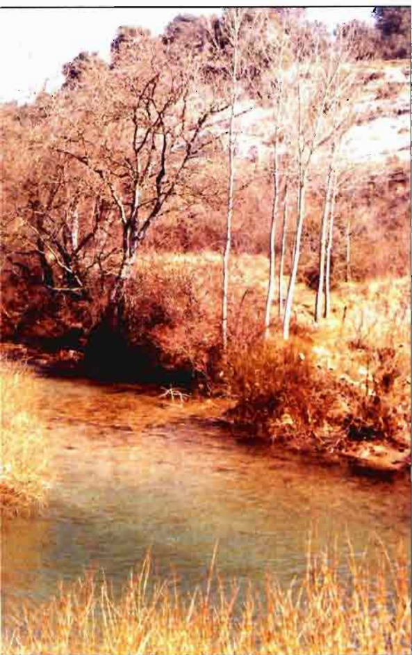
ancestral como la pesca.

Trucha, la talla mínima es de 19 cm, y el cupo de capturas es de 8 ejemplares. Black-bass, la talla mínima es de 21 cm y el cupo de capturas es de 8 ejemplares. Lucio, 40 cm y 8 ejemplares. Carpa, tenca y barbo, la talla mínima es de 18, 15 y 18 cm, respectivamente, y el cupo de capturas es de 12 ejemplares. El cangrejo de las marismas y el pez gato no tienen limitación.